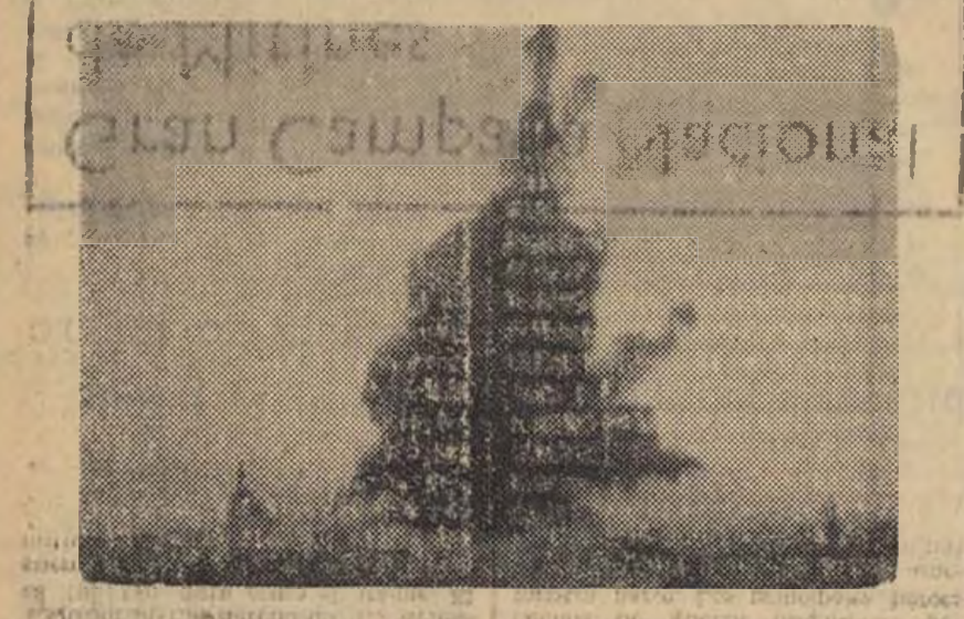
EN LA BATALLA ACTUO CON GRAN VIOLENCIA LA ARTILLERIA

Sin salir de los parapetos, nuestras tropas rechazaron el intento, en el que los facciosos sufrieron bastantes bajas.