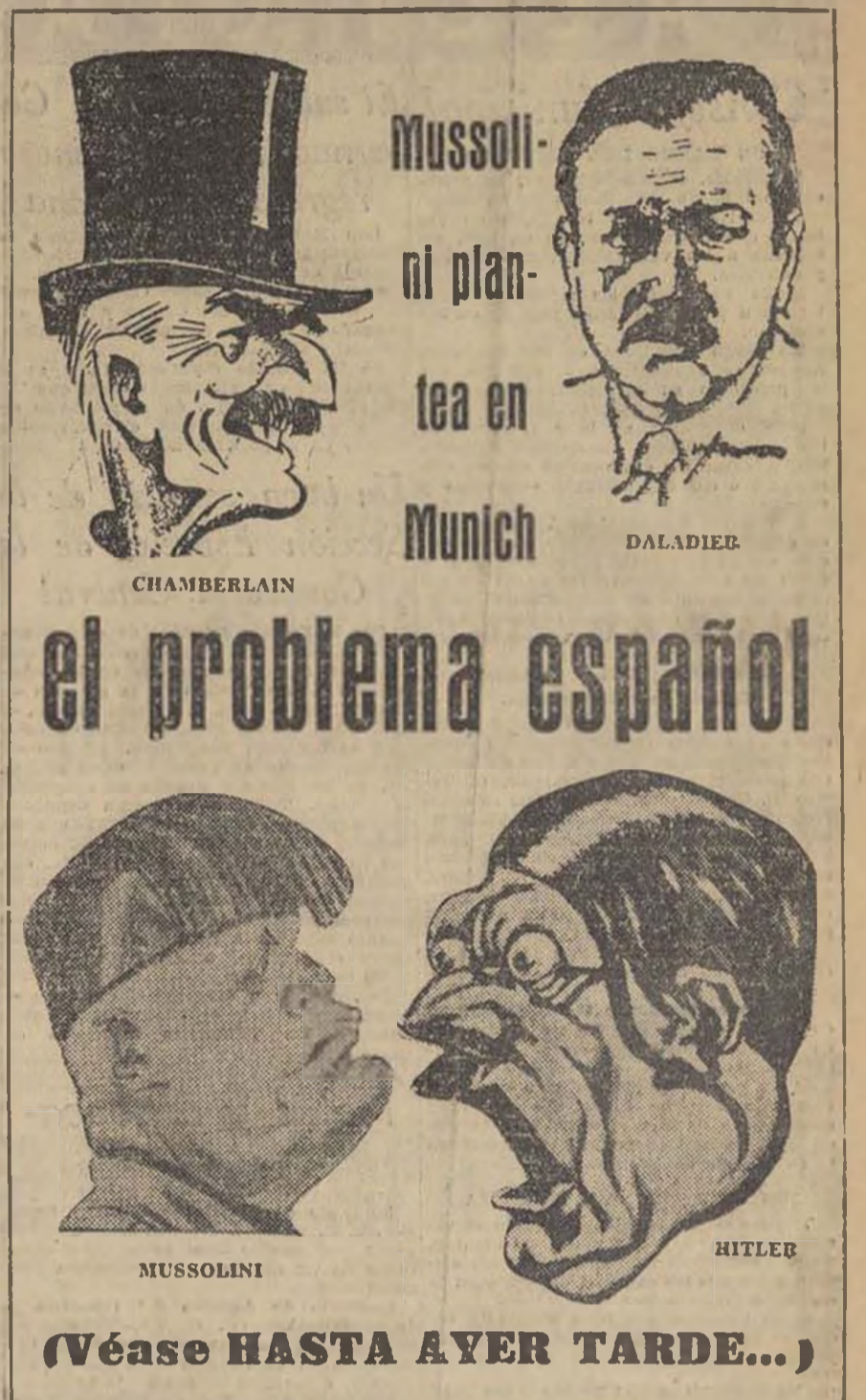
MUSSOLINI CHAMBERLAIN HITLER (Véase HASTA AYER TARDE...)

Frente de la producción Más actividad en la aplicación del programa de unidad U. G. T. - C. N. T. Se ha señalado repetidas veces la necesidad de que los acuerdos sean traducidos en hechos. La voluntad no es nada si no se traduce en acción. Acción sencilla, clara está, a las cláusulas de las disposiciones redactadas previamente por los organismos superiores de nuestras dos centrales. La aplicación de los puntos contenidos en el programa de unidad de acción U. G. T. - C. N. T., supone la movilización de las mejores energías del pueblo en la lucha por su independencia. Por otra parte, el retraso de su puesta en vigor, plena e íntegramente, al menos en lo que depende de las organizaciones sindicales, obedece, a nuestro juicio, más que a oposiciones de los "trabajados" que no pueden ni suponerse en ningún trabajo— a la pasividad con que se construye el armazón que ha de poner en práctica la unidad U. G. T. - C. N. T. Esto es, los Comités de Enlace. Ya el Comité Nacional marcó las normas para la creación de estos organismos por industrias, geográficamente y en los lugares de trabajo. No obstante, muchas tareas de carácter fundamental si-