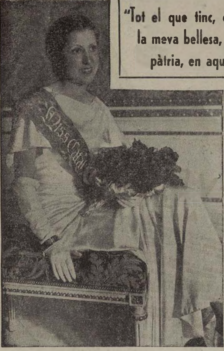
ANTONIETA ARQUES, Miss Europa 1936 (Centelles)

"Tot el que tinc, el meu somriure; la meua bellesa, ho dono a la meua pàtria, en aquests dies desgraciada"