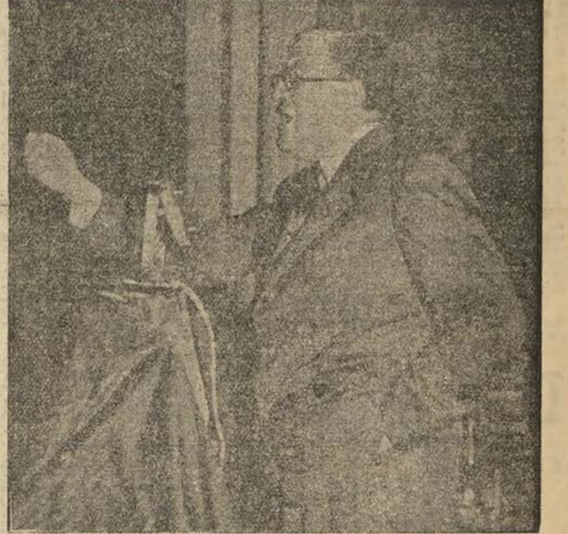
JULIO ALVAREZ DEL VAYO la voz de España ante las delegaciones internacionales

do, lo vuelva a ser en casos de impotencia. Lo peor para la Sociedad de Naciones es que ignora o fingiera ignorar esta situación y con ello se