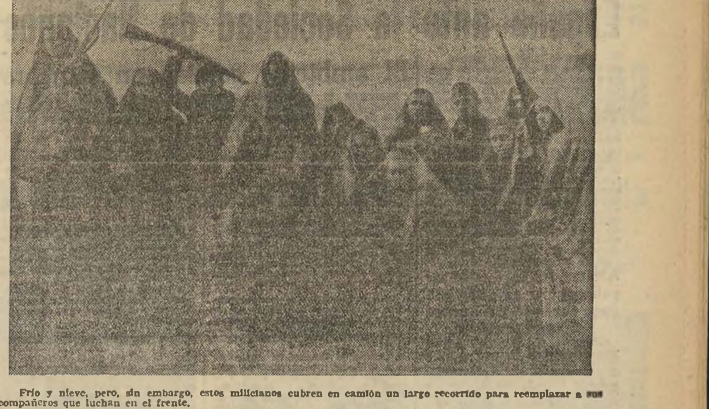
Frío y nieve, pero, sin embargo, estos milicianos cubren en camión un largo recorrido para reemplazar a sus compañeros que luchan en el frente.