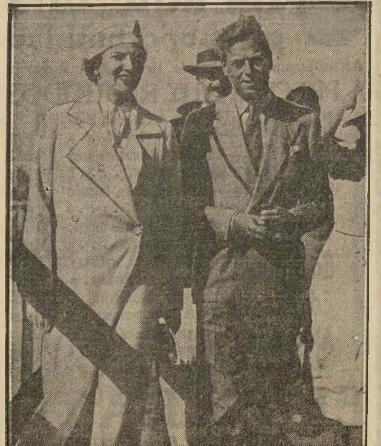
El duque de Kent, en quien parecía que abdicaría Eduardo VIII, se ha deslizado de la corona que deja su hermano.

Ha muerto Pirandello Su técnica teatral inspiró la escena moderna durante varios años Su decadencia comenzó al abrazar el fascismo