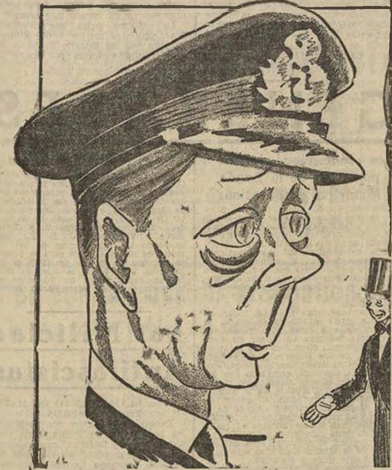
LONDRES, 10. (Urgente).— A las cuatro menos veinte de esta tarde la Agencia Reuter facilitó el siguiente mensaje: "El rey ha abdicado."

Se ha portado como un hombre! El rey de Inglaterra ha abdicado