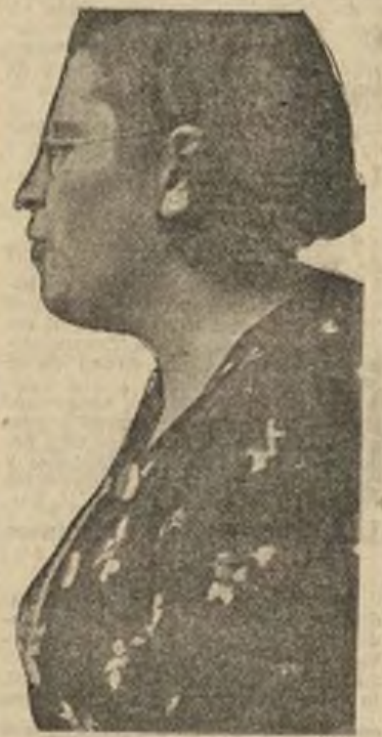
—Nada de esto: nuestra filosofía es el resultado de un examen histórico y no la modificaremos nunca. No hemos hecho más que adaptarnos a las necesidades del momento y así establecer las bases de convivencia, ya que lo que cuenta en la actualidad es ganar la guerra.