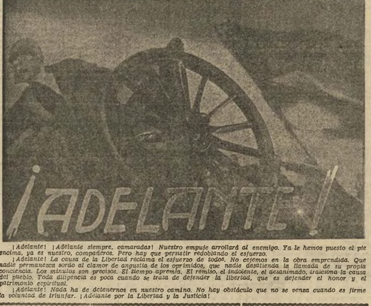
¡Adelante! ¡Adelante siempre, camaradas! Nuestro empuje arrollará al enemigo. Ya le hemos puesto el pie encima, ya es nuestro, compañeros. Pero hay que persistir redoblando el esfuerzo.

¡Adelante! La causa de la Libertad reclama el esfuerzo de todos. No cejemos en la obra emprendida. Que nadie permanezca sordo al clamor de angustia de los oprimidos, que nadie desdicienda la llamada de su propia conciencia. Los minutos son preciosos. El tiempo apremia. El renio, el indolente, el acasimado, traicione la causa del pueblo. Toda diligencia es poca cuando se trata de defender la libertad, que es defender el honor y el patrimonio espiritual.