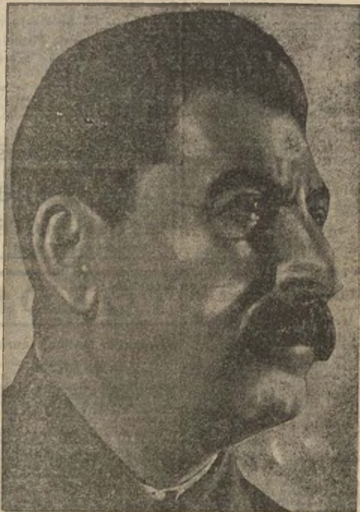
STALIN, EL GRAN CONSTRUCTOR DEL SOCIALISMO

Ayer se presentó al Congreso el texto definitivo de la Constitución de la U. R. S. S.