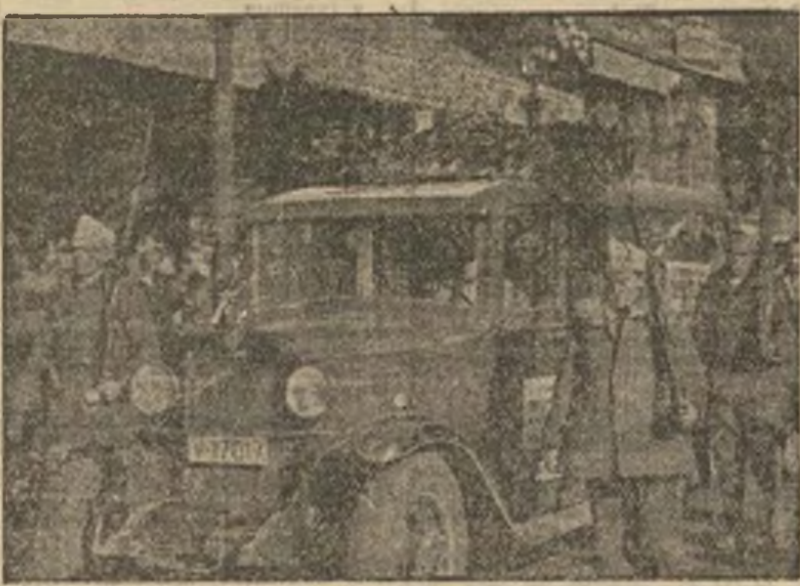
Ayer, por la mañana, llegó a Barcelona el cadáver de Hans Beimler, el diputado comunista alemán muerto gloriosamente en la defensa de Madrid.

Ayer mañana, a las doce y cuarto, llegó a Barcelona el cadáver del ex diputado alemán y miembro del Comité Central del Partido Comunista de aquel país, Hans Beimler, muerto en el frente de Madrid en lucha contra el fascismo.