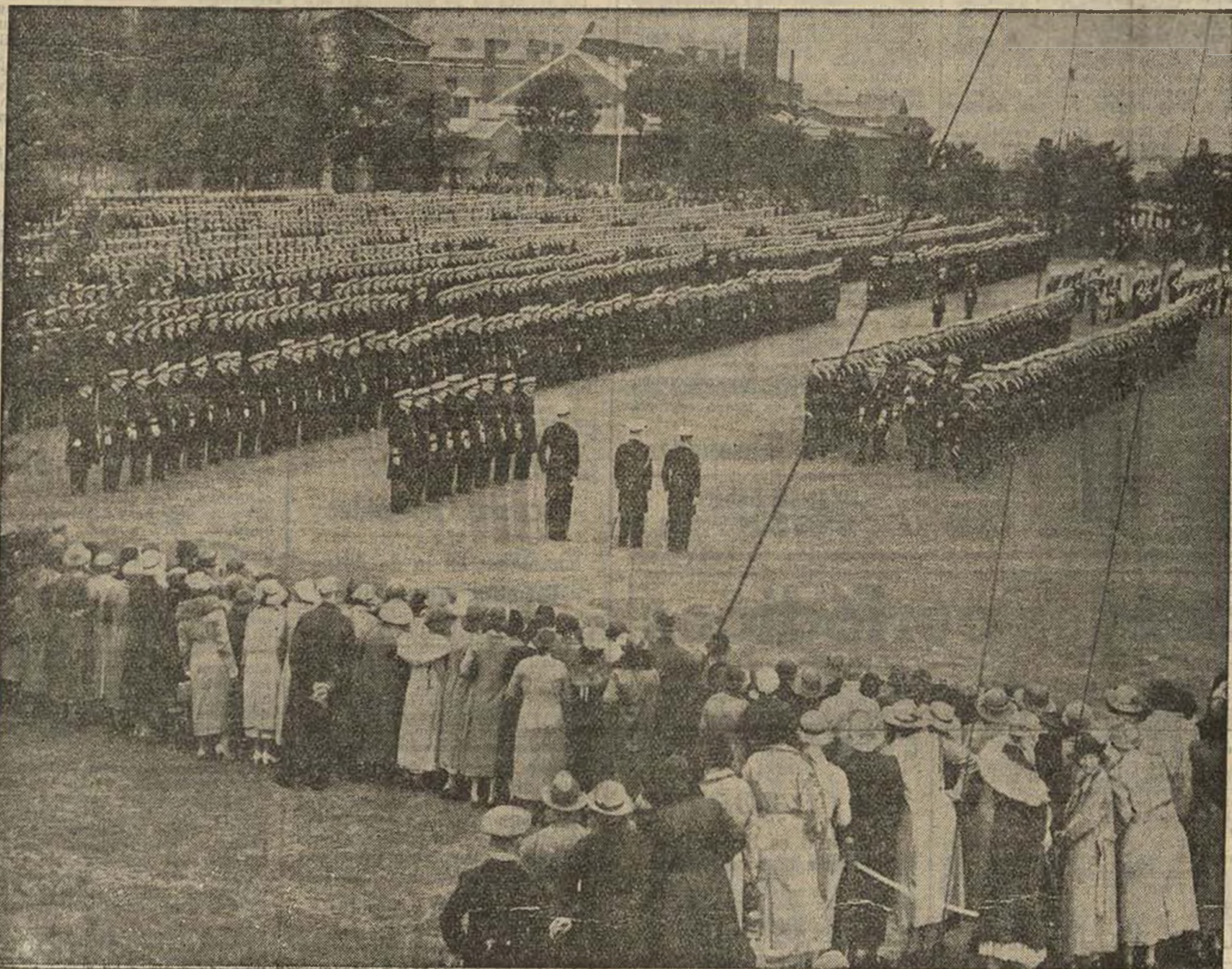
La actualidad rinde un tributo sentimental al monarca británico. Eduardo VIII, a quien las últimas noticias atribuyen el propósito de inmolarse el trono imperial por un amor espontáneo y romántico. He aquí a Eduardo VIII en el primer acto oficial de su reinado, la revista naval de Portsmouth.

La opinión británica, agitadísima en el caso de la señora Simpson, prometida del monarca británico. La austera tradición imperial británica se quiebra con la abdicación de Eduardo VIII, para casarse con la señora Simpson