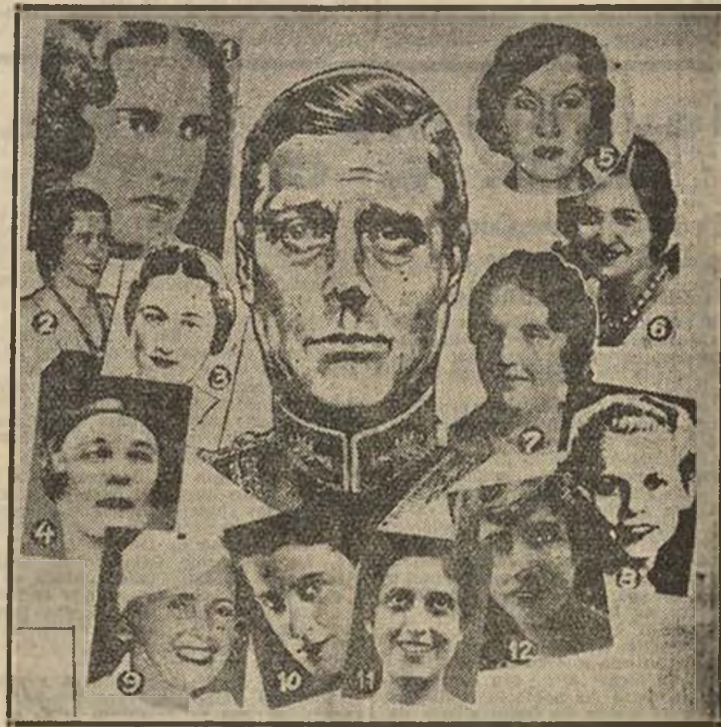
El monarca inglés y emperador de la India, tiene, como todo mortal, su lado sensible. Durante la época en que cautivaba al gran mundo como príncipe de Gales se le conocieron varios amores más o menos sonados, y que la fotografía recoge, engrandeciendo la élite real con la de sus favoritas, desbandadas hoy todas por los encantos de la señora Simpson.

conferencia diocesana se elevó formalmente contra toda innovación que pudiera apartarse al ceremonial de la coronación susceptible de atenuar su carácter sagrado. En una interviú concedida a la "Press Association" el obispo ha declarado: "parece que el rey se muestra indiferente a la práctica pública de la religión."