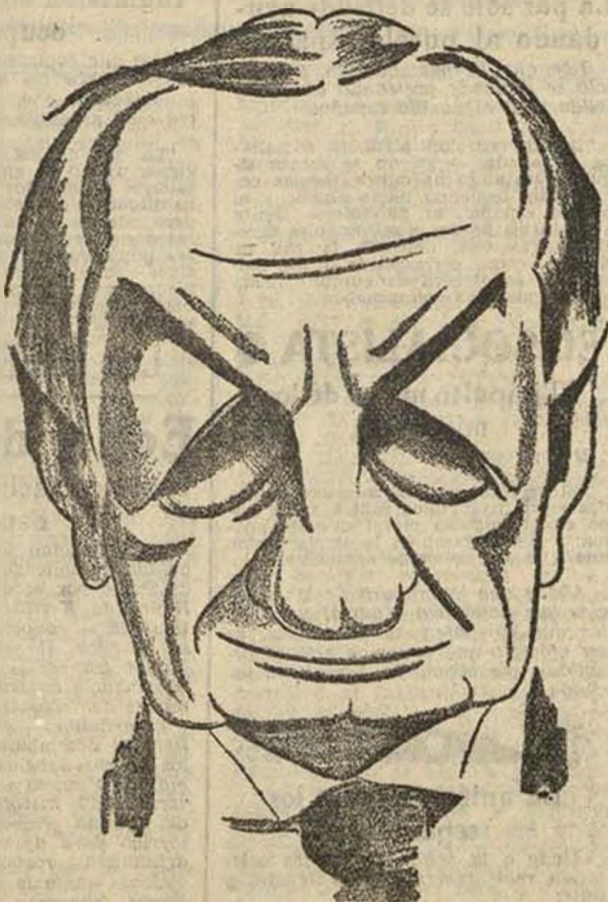
Ante la boda del rey, que rompe una tradición tantas veces secular, ¿qué harán Baldwin y su Gobierno?

PARIS, 3.—Presentará Baldwin la dimisión del Gobierno? Todo hace suponer que la crisis constitucional gravísima que se ha abierto en Inglaterra debido a los deseos del rey de casarse con mistress Simpson, alcanzará incluso al Gobierno Baldwin en el caso de que el rey continúe inclinado a contraer matrimonio con su amiga. Según los informes que se tienen en París, el problema más serio es el que plantea la Iglesia anglicana. Mrs. Simpson es católica y divorciada dos veces. La Iglesia anglicana se niega a modificar en absoluto las prácticas establecidas. Según noticias que han llegado a París, Baldwin visitó anoche al rey, con quien habló durante más de dos horas. A la salida de la reunión fué convocado Consejo de ministros, que duró hasta hora avanzada de la noche. Según el periódico "Excelsior", Mrs. Simpson partirá dentro de breves días para Francia, en donde se le unirá el rey.