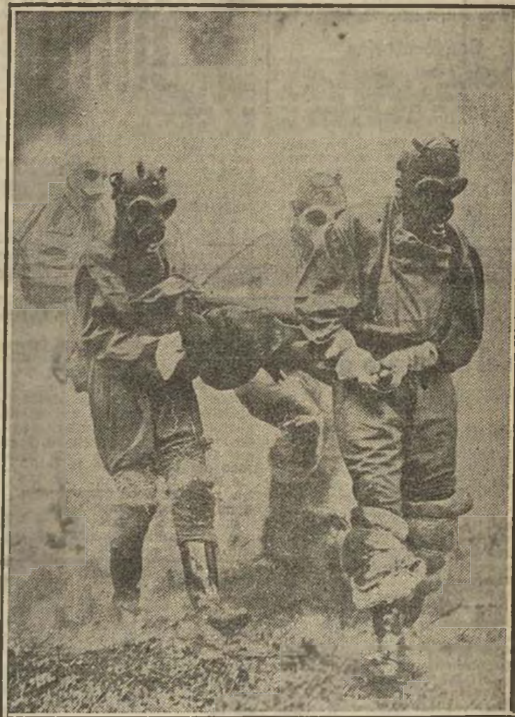
¿A qué extremo de barbarie quiere llevar la guerra el fascismo criminal?

MADRID, 2. — Se han presentado en nuestras líneas de Montoro tres soldados, uno de ellos portador de una careta anti-gas.