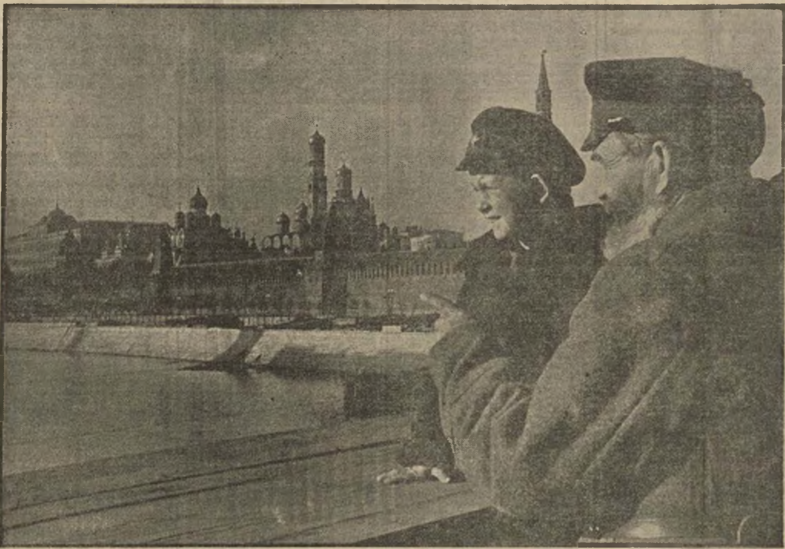
Viejo cosaco del Don. Su memoria guarda fiel, preciso, el recuerdo de los últimos años de la Rusia imperial. Una Rusia pavorosa: deportaciones en caravana al espanto de Siberia; encarcelamientos en mazmorras y calabozos horribos; persecuciones despiadadas al paria, al campesino, que morían a manos de una policía de instintos feroces, de conciencia corrompida...

Al otro lado del puente revolucionario Francia sabe ya que van contra el/a