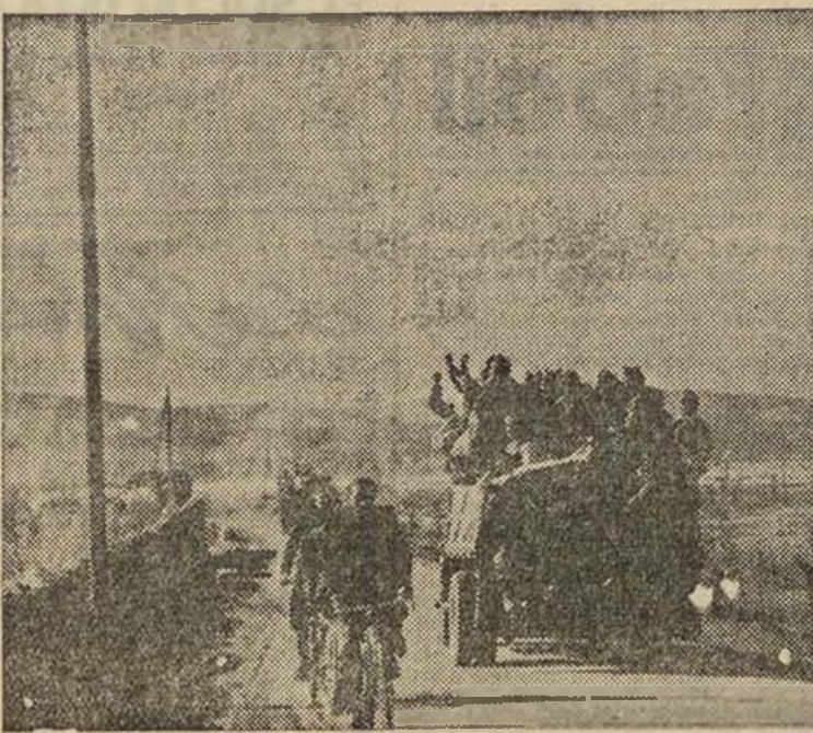
Unos camiones conduciendo hombres de refuerzo al sector del Tajo