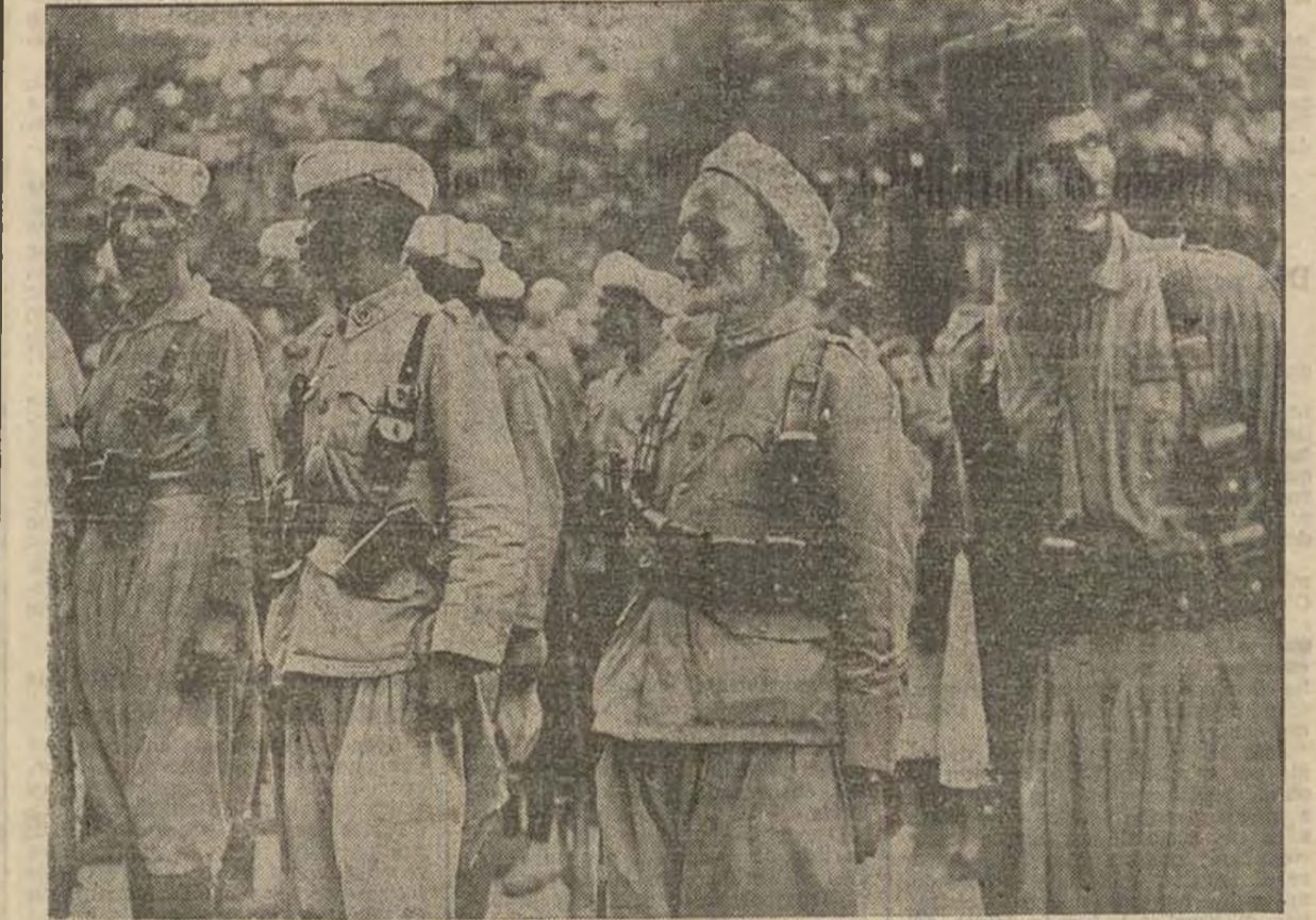
Estas bandas morunas, perfectamente pertrechadas por el fascismo internacional, fueron las que las derechas españolas, las que se decían representantes del cristianismo en España, trajeron a la Península para que asesinaran al pueblo. En el "Ejército nacional" eran éstas y las hordas mercenarias del Tercio Extranjero las principales unidades. Peleaban — y pelean — por el sueldo y por las mujeres de los españoles muertos en defensa de la Libertad de su tierra y de la democracia universal. Y es esta misma canalla la que ahora huye ante el empuje avasallador de nuestras heroicas Milicias.