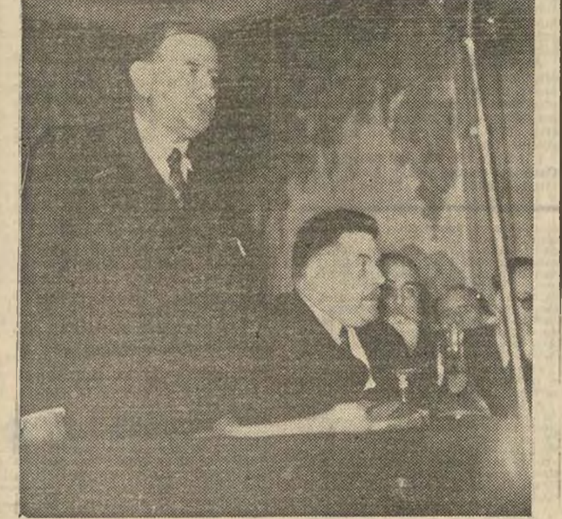
El señor Daladier pronunciando su discurso en el último Congreso del Partido Radical socialista. A su izquierda el señor Herriot.

PARIS, 30.—Los periodistas han interrogado al ministro de la Guerra, señor Daladier, durante la visita de éste a la región fortificada del Norte. El señor Daladier ha hecho entre otros, las siguientes declaraciones: "Durante esta visita he podido estudiar detenidamente el poderoso sistema de fortificación que defenderá la región industrial del Norte. Los trabajos de ampliación de estas fortificaciones han empezado ya, y dentro de un plazo relativamente breve