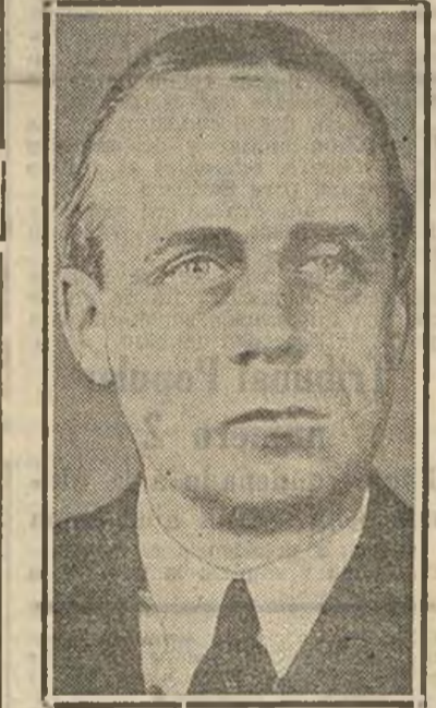
VON RIBBENTROP, embajador de Alemania en el Reino Unido. LONDRES, 30.—Von Ribbentrop ha estado en el Palacio de Buckingham, donde ha presentado sus cartas credenciales al rey Eduardo VIII.