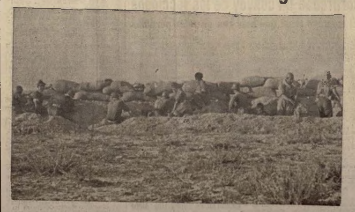
Cerca un poblado del frente de lucha en Aragón, estos milicianos, al abrigo de sólidos parapetos, disparaban sobre el enemigo desconcertado ante el certero fuego.