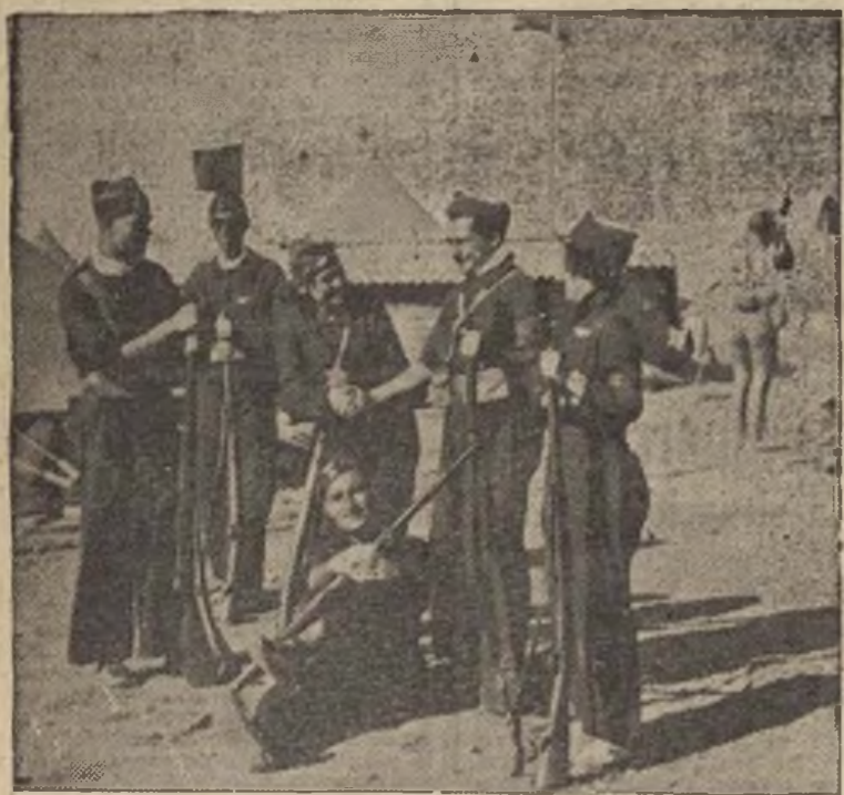
Entre los varios casos de parejas que han salido para el frente, abundando las ditzuras del hogar, he aquí a dos matrimonios que en el frente de Aragón se batían bravamente. Un descanso después del victorioso combate.