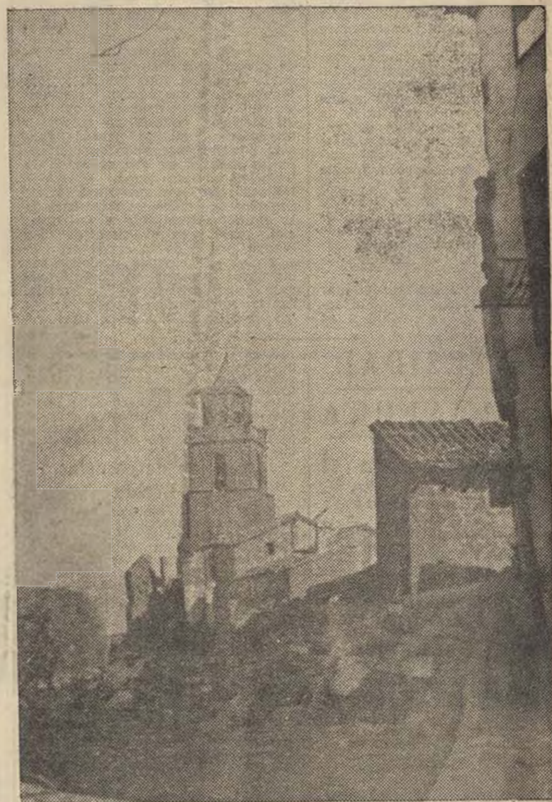
Bombardeado ferozmente por los rebeldes, este pueblo, llamado Las Casas, está casi en ruinas, bajo las cuevas yacen inofensivos niños inocentes.

Organización y disciplina son las divisas. El pueblo las acepta alborozado. ¿Cómo si no? La historia nos ha deparado la feliz coyuntura de crear un mundo nuevo.