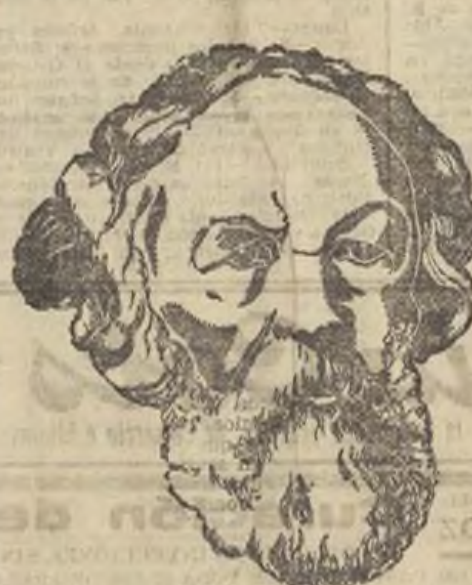
MIGUEL A. BAKUNIN 1814-1876

erudito historiador del anarquismo. Las ideas del revolucionario de Praymichino las profesan hoy millones de hombres. No estará de más que, quien no lo haya hecho todavía, empiece a familiarizarse con él.