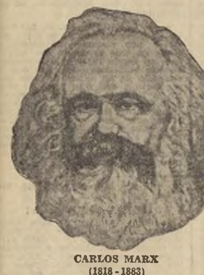
CARLOS MARX (1818-1883)

Veinte años y el camino recorrido es inmensurable. Carlos Marx, faro y guía de socialistas y comunistas, realizó para la articulación del movimiento obrero una labor realmente asombrosa.