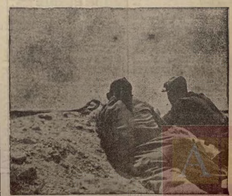
Estos dos milicianos disparan incesantemente sobre el enemigo, durante un duro combate sostenido cerca del pueblo de Osera.