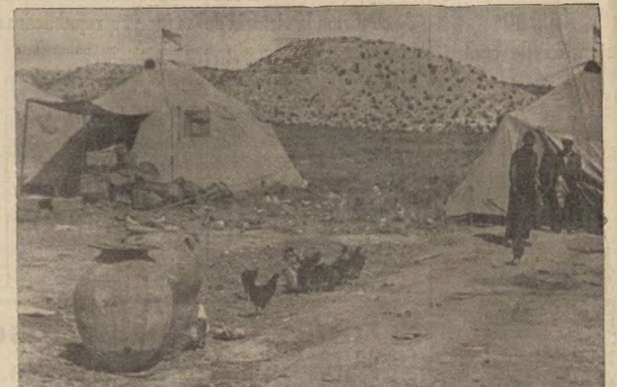
A dos kilómetros de la línea de fuego, cerca de Huesca, este depósito de viveres asegura el alimento substancial de nuestros valientes milicianos.