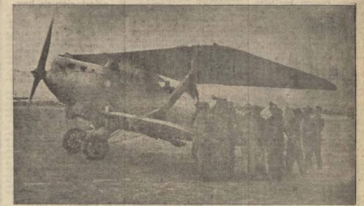
Llenos de ansiedad por conocer noticias favorables de los diferentes frentes en que luchan los leales a la República, este grupo de milicianos se agolpa junto al avión que acaba de aterrizar, trayéndoles magnificas. Ello produce el natural entusiasmo.