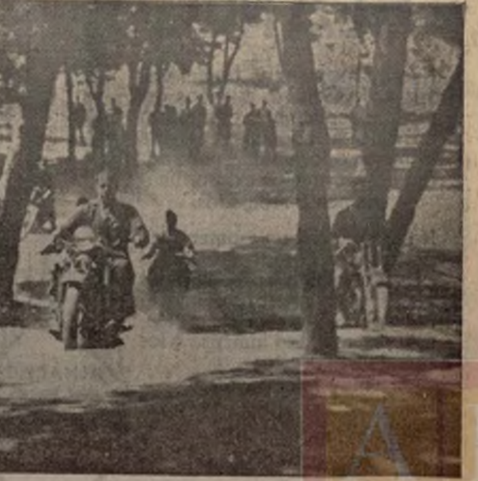
Una sección de ametralladoras motorizadas, en cuyo manejo se instruyen varios alumnos que hacen oposiciones de ingreso al "Batallón de Hierro".