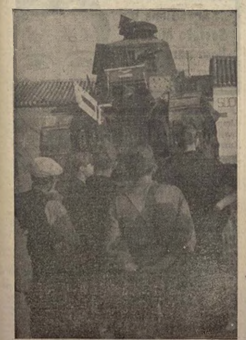
Al frente extremeño ha enviado el Gobierno gran número de tanques que han de coadyuvar, con la eficacia que les es reconocida, al avance victorioso de las columnas leales que día por día inflingen a los rebeldes vergonzosas derrotas. Antes de ser enviados a las líneas de fuego son revisados esos tanques por el teniente González, que manda la sección.