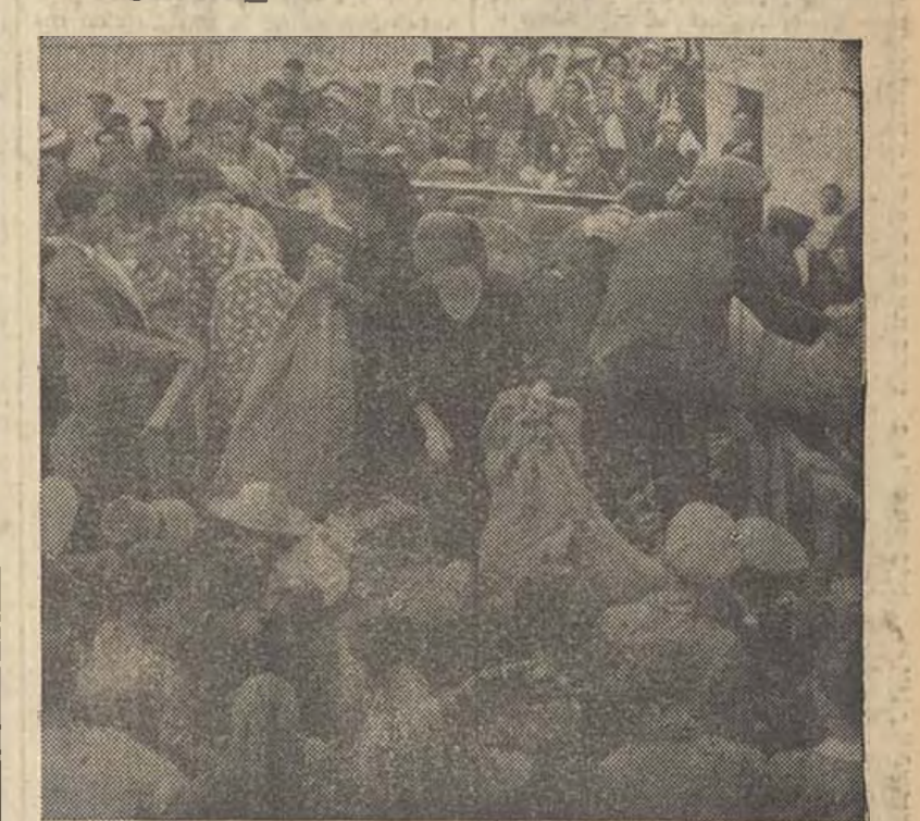
Ante las tropelías de los facciosos, mujeres y niños huyen de sus pueblos en busca de una mayor seguridad. En la foto puede verse la emocionante llegada a Calzada de Oropesa de las mujeres de Navalalmoral de la Mata, las cuales, con sus hijos y con el modesto ajuar que han podido recoger, se han trasladado en un camión a dicha localidad.