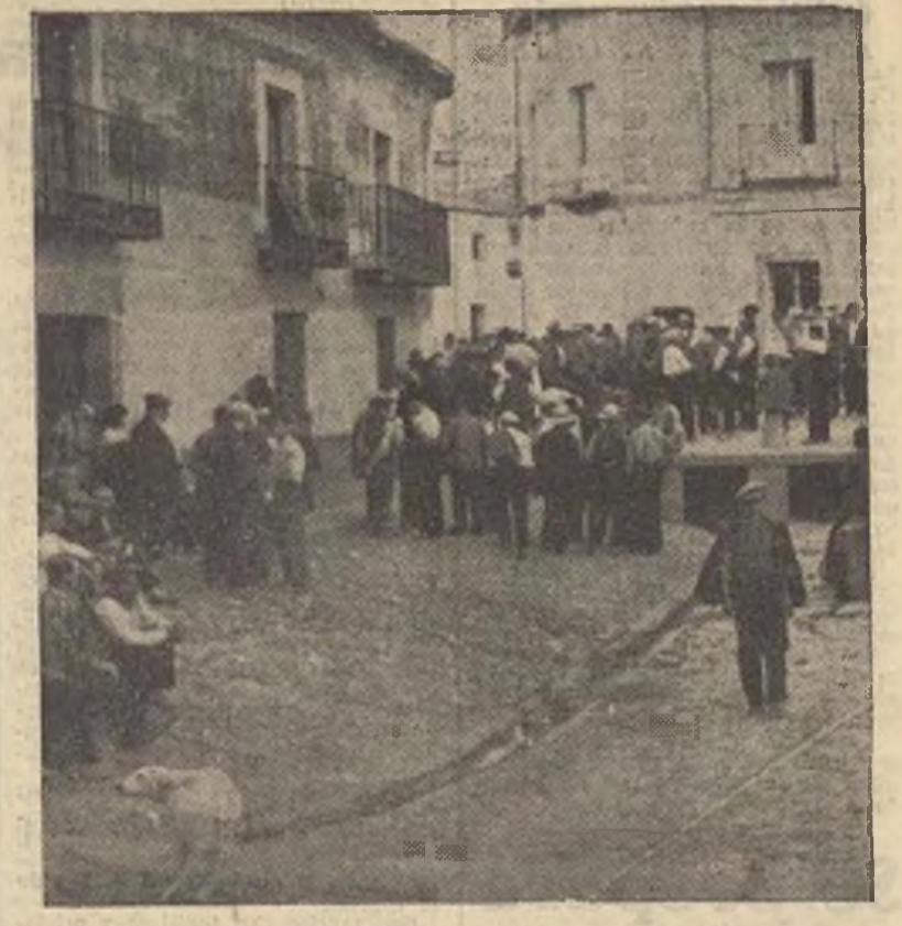
Animados por el bello ardor de que dan unánimemente pruebas todos los buenos españoles, los campesinos esperan impacientes el armamento para dirigirse a engrosar las fuerzas leales que operan briosamente contra los facciosos en la ruta de Madrid a Extremadura.