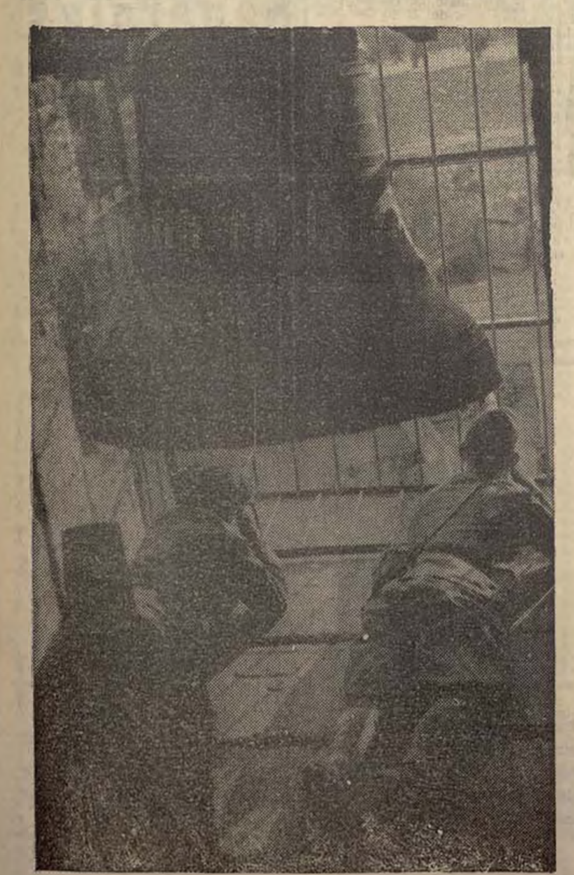
Convenientemente parapetados, en el campamento de una población de la provincia de Cáceres, estos bravos muchachos resistieron valientemente a las fuerzas rebeldes, a las que obligaron a retirarse, dejando abandonados varios muertos y heridos y abundante material de guerra.