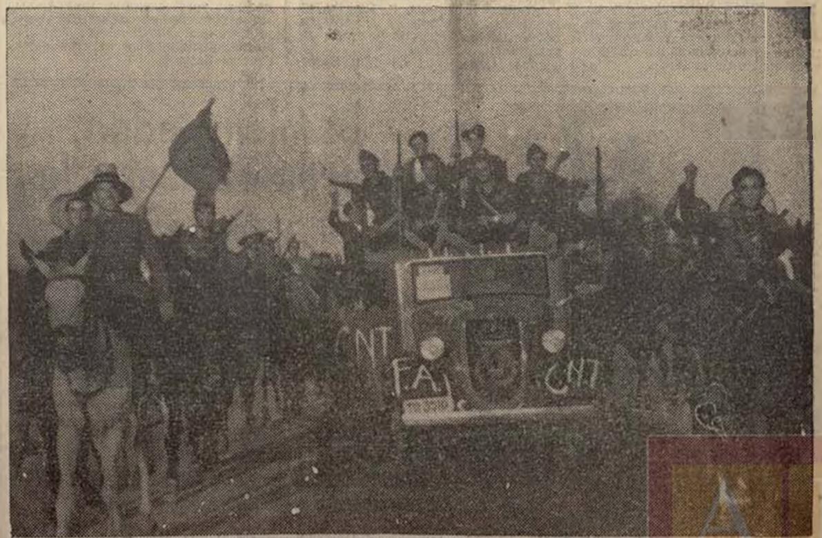
El primer grupo de escuadrones de la Escuela Superior de Guerra y unos fuertes destacamentos de milicianos madrileños han batido, de manera decisiva, a los facciosos en Navalalmoral de la Mata. He aquí un momento del victorioso avance de dichas fuerzas.