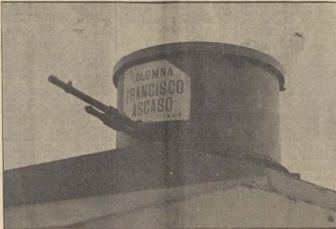
El esfuerzo combativo de Barcelona manifestóse de nuevo con la organización perfecta y acabada de la poderosa columna salida anteyar hacia los frentes de Aragón. Magníficamente dotada de modernísimo material de guerra y preparada hasta en sus menores detalles, la columna llamada de "Francisco Ascaso" lleno de entusiasmo y esperanza, al desfilarse por las calles de Barcelona, a los ciudadanos que esperan la victoria aplastante y definitiva de la República.