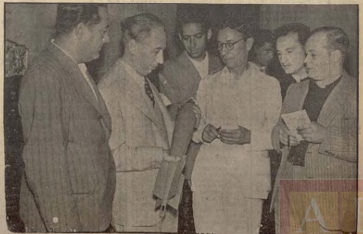
El Presidente de la Generalidad, señor Companys, exhibiendo a los periodistas que hacen información en el Palacio de la Generalidad la primera bomba de aviación fabricada en Cataluña. Se trata de un modelo de doce kilos, de gran potencia y eficacia.