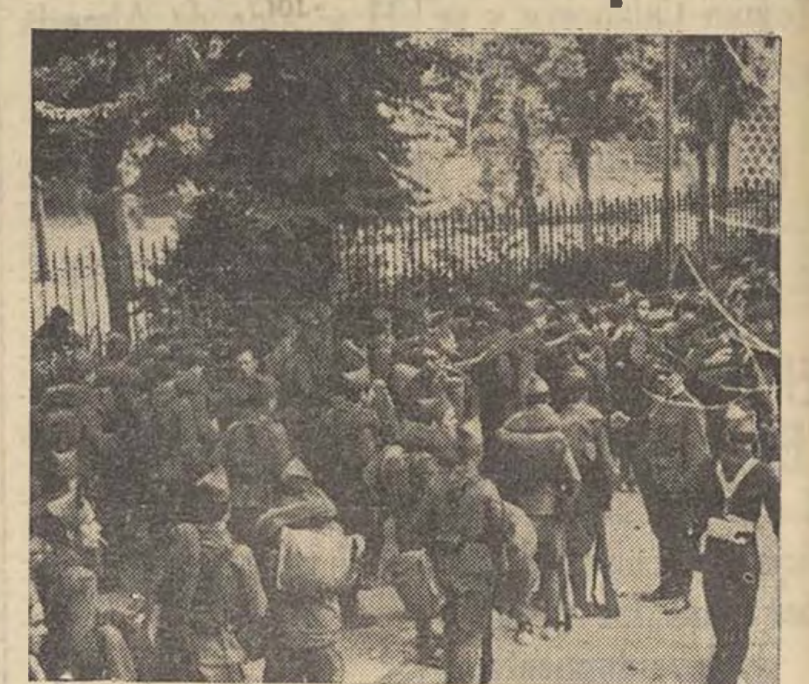
Puede verse el numeroso grupo de soldados y milicianos en el momento de su llegada al frente de Guadarrama, para refuerzo y descanso de los que allá iniciaron el victorioso avance.