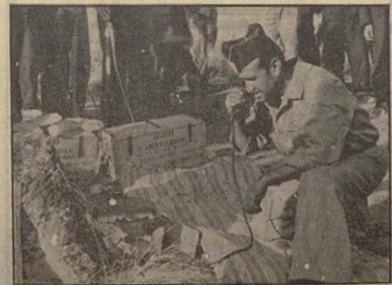
No todo en la guerra debe atribuirse a las armas. Nada serían éstas sin la aportación eficaz e inteligente de los servicios auxiliares, que en muchas ocasiones se convierten en esenciales. Ese soldado de Ingenieros que prueba una línea telefónica recién instalada, y que la está utilizando para comunicar la toma de Navalperal de Pinares, es buena prueba de nuestro acierto.