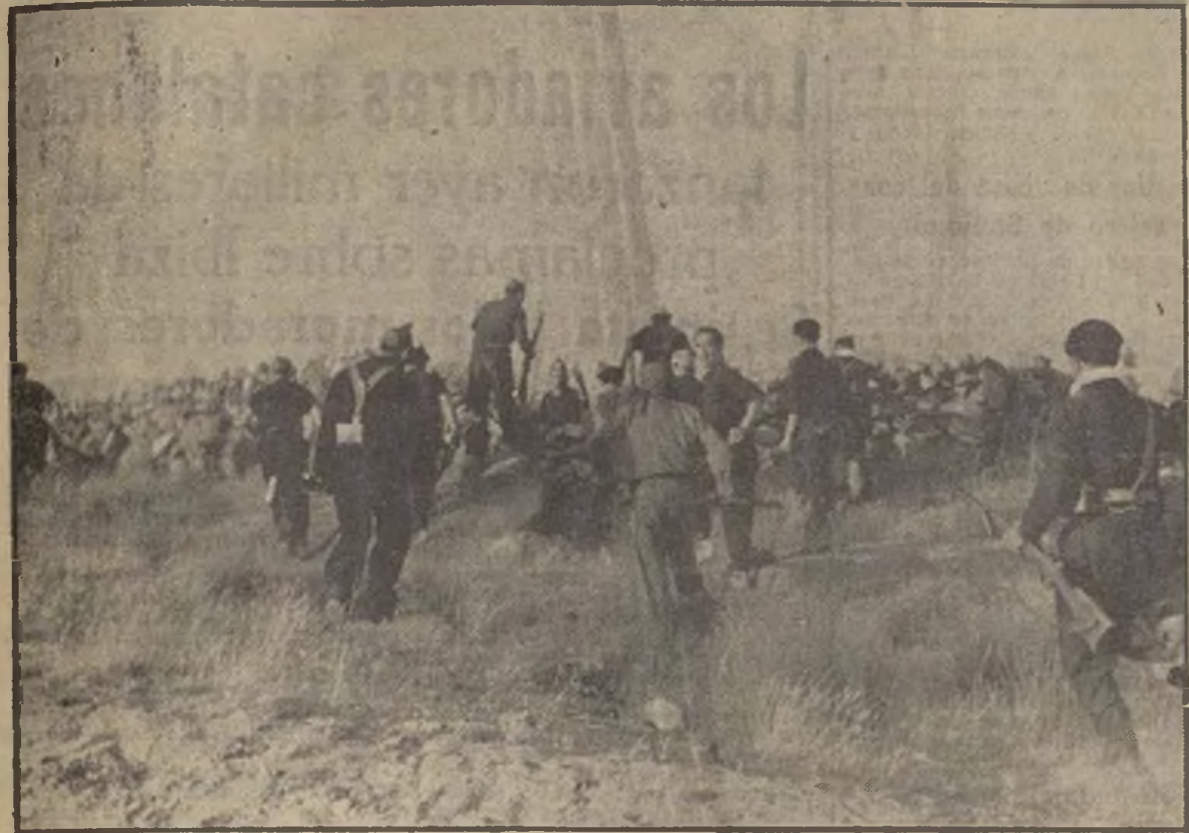
He aquí uno de los primeros documentos gráficos de la lucha en el Sur de España. Como en todas partes, el entusiasmo de los leales es extraordinario. Ved, si no, a estos milicianos rompiendo en su avance unas cercas en la provincia de Córdoba, cercas tras las cuales se habían parapetado los fascistas, que huyeron a la desbandada.