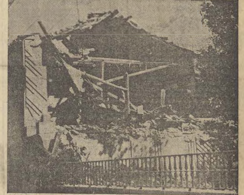
De la intensidad de la lucha en el Guadarrama, donde van cayendo en poder de las fuerzas leales posiciones que ocupaban los facciosos, da idea este grabado, donde puede verse el estado en que ha quedado una de las Casas del Pueblo después del bombardeo entre las tropas milicianas y los revoltosos.