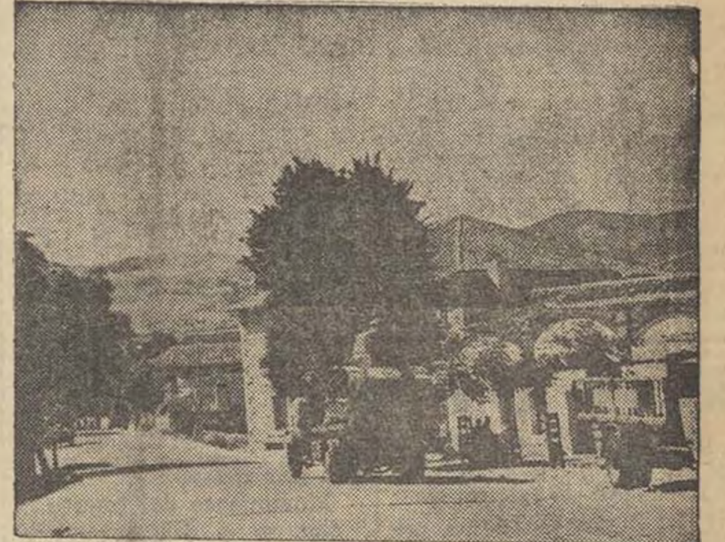
El Guadarrama, en toda su extensión, va conquistándose por las fuerzas leales, ante cuyo empuje arrollador huye a la desbandada el enemigo. Ved en el grabado un carro de asalto sobre un camión a su paso por el pueblo de Guadarrama para dirigirse a la línea de fuego. Al fondo, las crestas del Alto de León ardiendo por efecto de las bombas que lanzan los aviones leales al Gobierno.