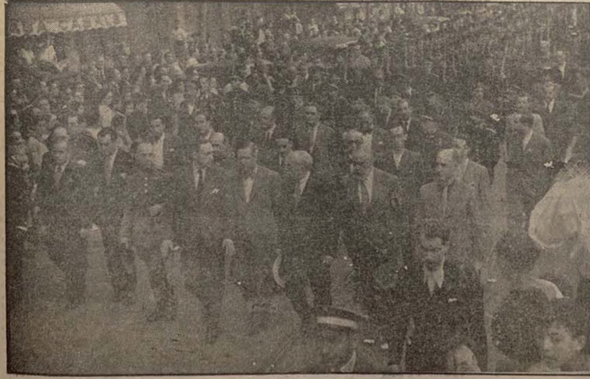
VIENDOSE EN LA PRESIDENCIA DEL DUELO NUTRIDA REPRESENTACION DE AUTORIDADES CIVILES Y MILITARES