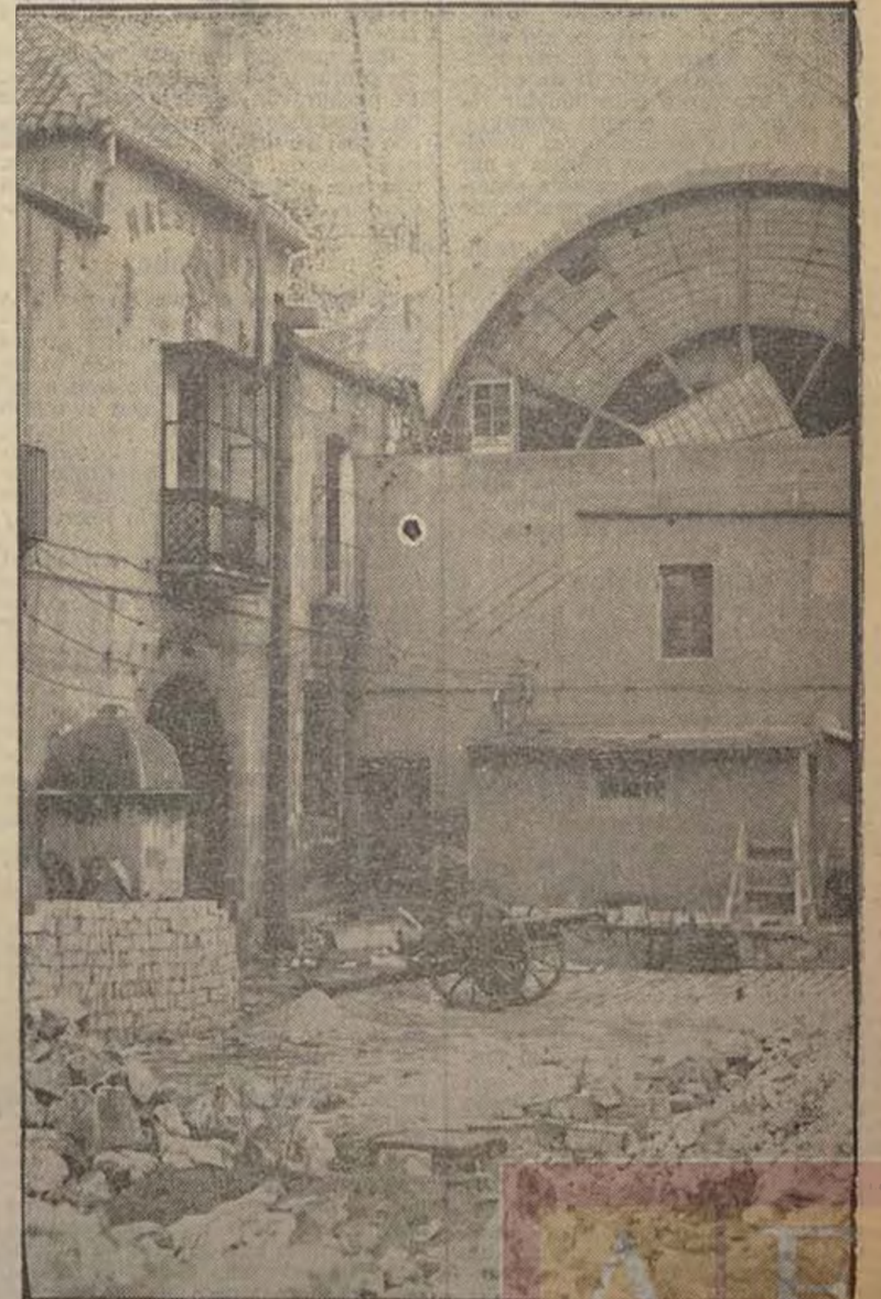
El asalto a la Maestranza constituyó uno de los más sangrientos episodios de la lucha. He aquí la entrada de lo que fue el último reducto de la sublevación, después del ataque decisivo