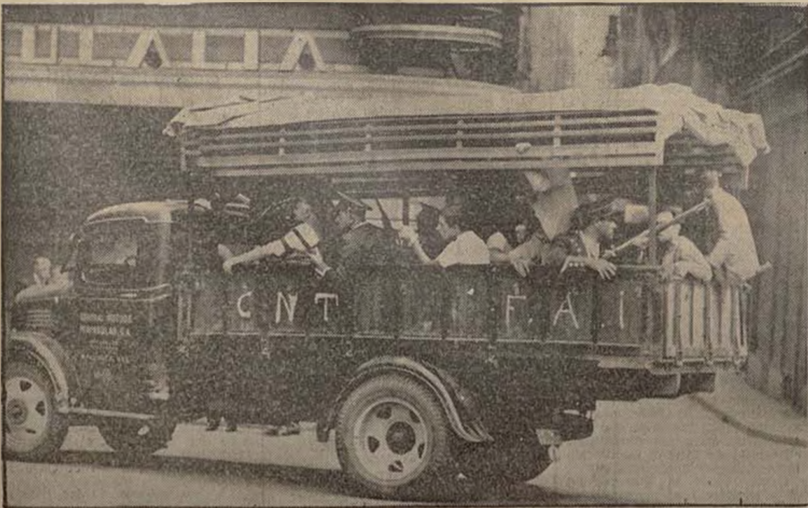
Movimiento de Escuadra y miembros de las milicias populares en uno de los camiones que ejercen la vigilancia la ciudad