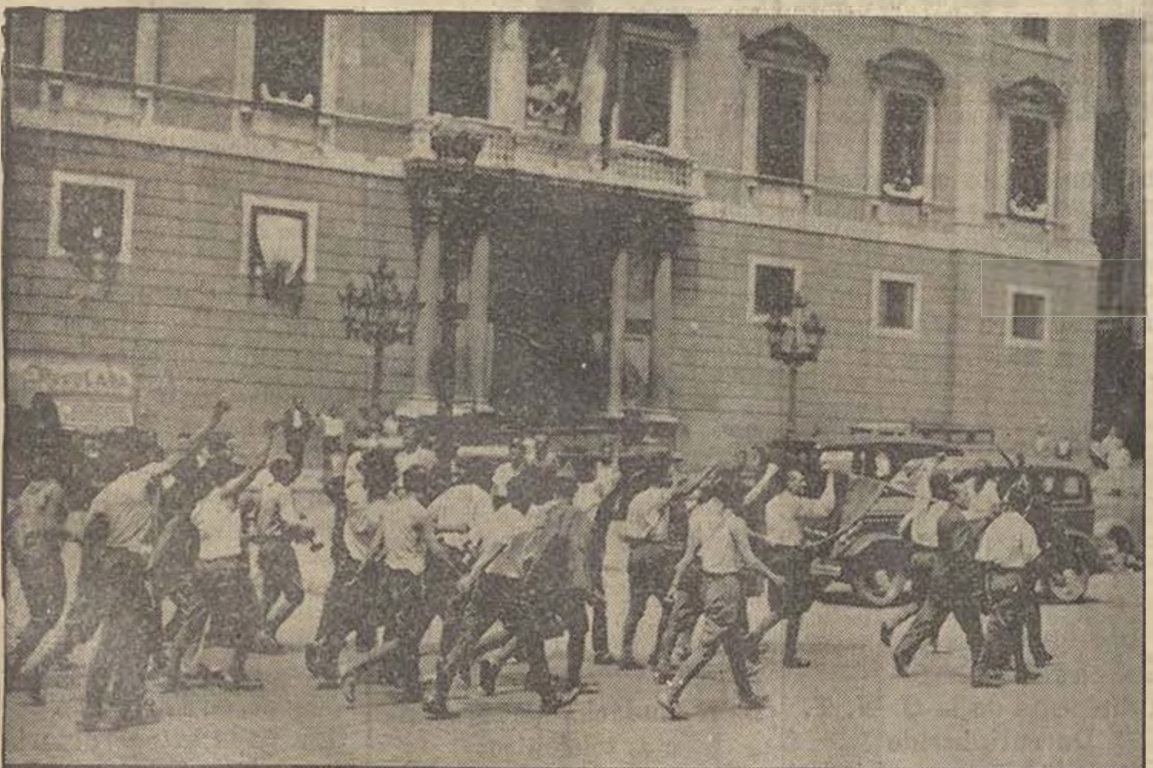
El paso frente a la Generalidad de los soldados que pertenecieron a las unidades sublevadas y que licenció el Gobierno apenas sofocada la rebelión