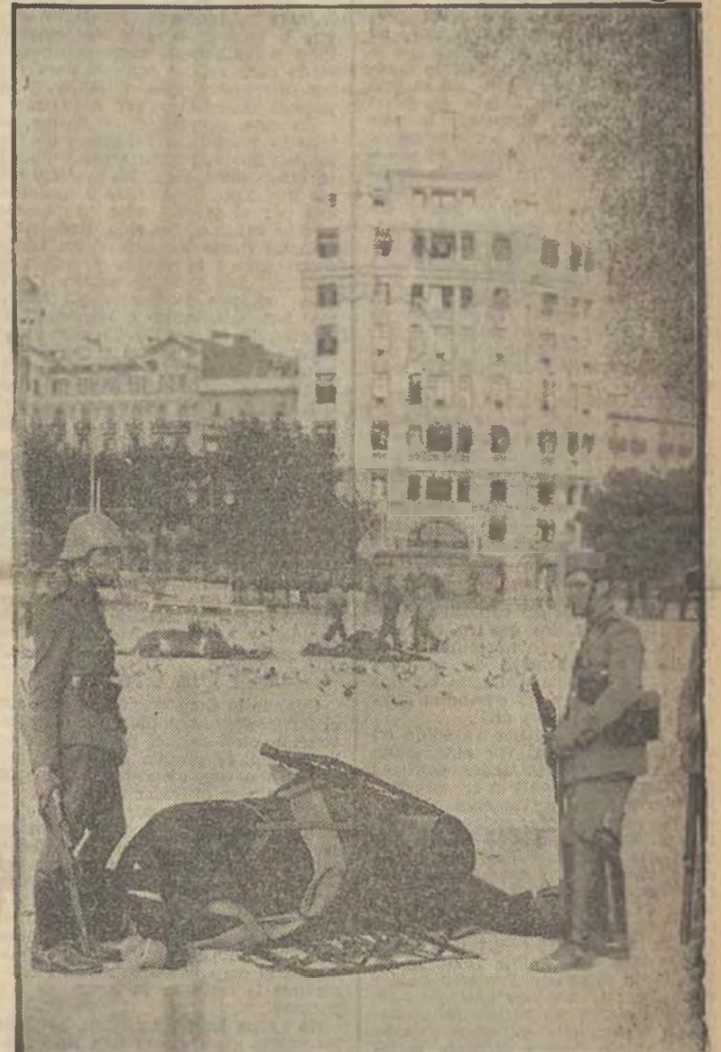
La Plaza de Cataluña momentos después del fuerte combate que la dejó libre de rebeldes