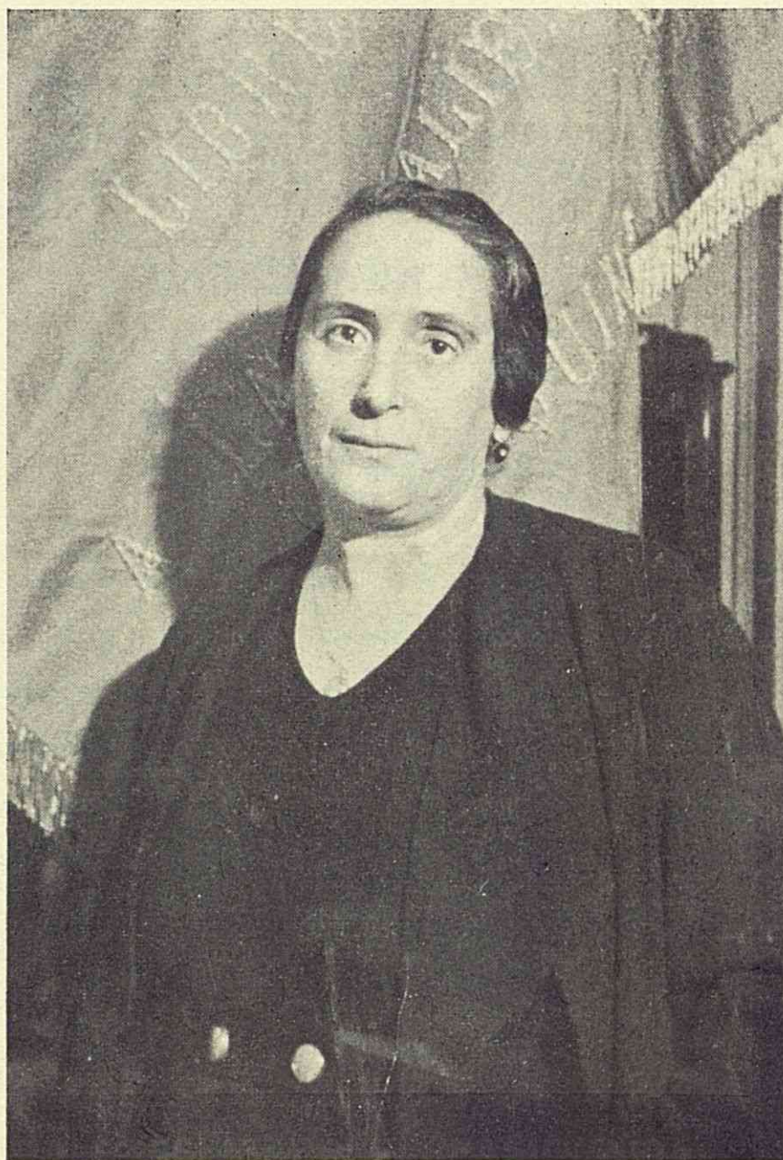
DOLORES IBARRURI (PASIONARIA)