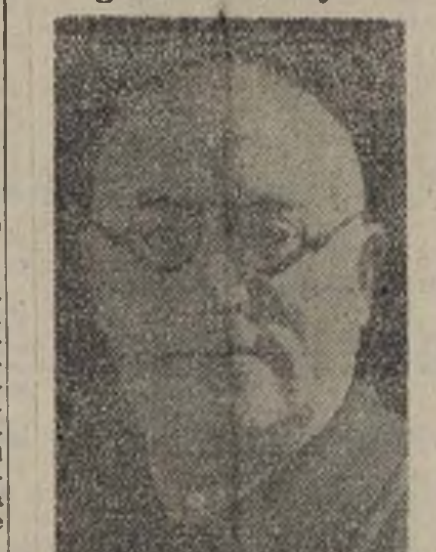
El general Cárdenas, presidente de la República hermana de Méjico, ha concedido a nuestro general Miaja la Cruz del Mérito Militar.