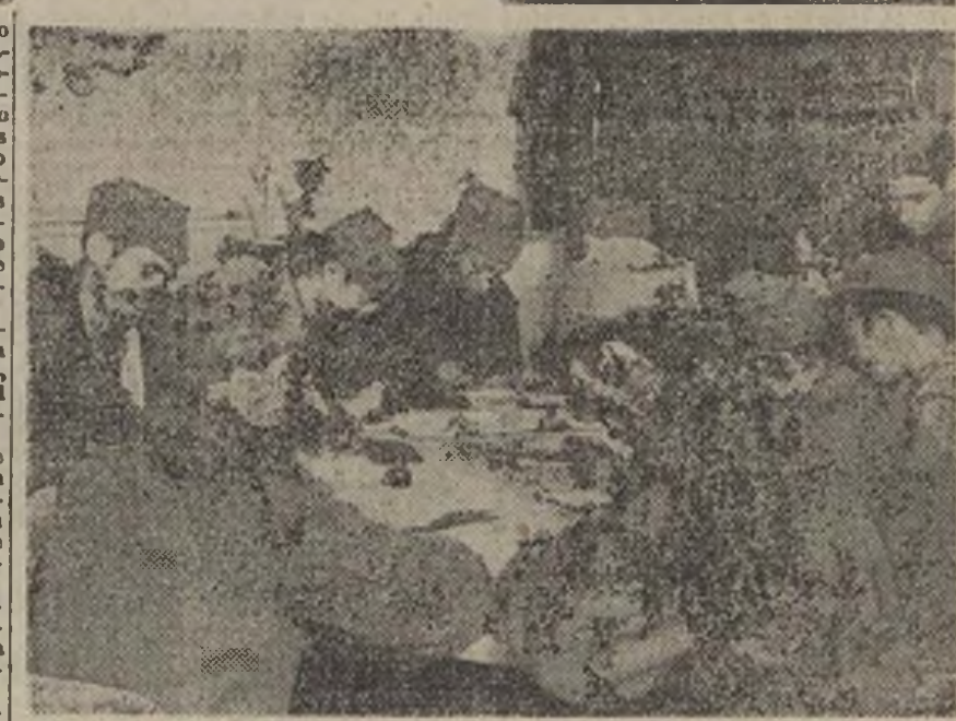
En un rincón del "Llar Català", los soldados con permiso en Madrid escriben a sus familias.

Ahora se está montando, también para los frentes, un gran servicio de biblioteca circulante. Están empezando a llegar los miles de libros seleccionados que envía la Generalidad para ello. La central se encuentra aquí; pero para su mejor difusión se organizan otras subcentrales, que mandarán los libros directamente a las trincheras en los distintos sectores del Centro.