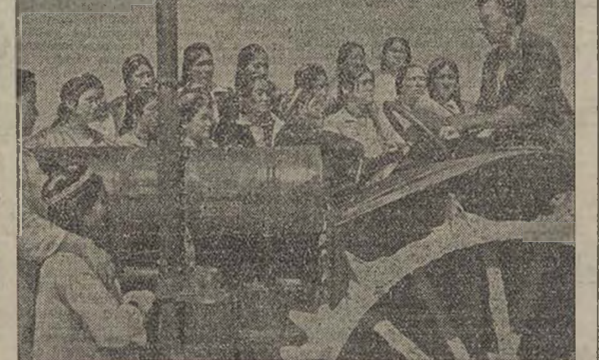
En la estación de maquinaria agrícola de Pachtabadsk, Uzbekistán, se instruye a los nuevos conductores de tractores para las faenas agrícolas, en lo cual ocupa la mujer un lugar conspicuo.

París, 24.—"Le Peuple" dice que los Gobiernos de Londres y París se habían dado se ha concedido extraordinario interés a esta nota, por tenerse la seguridad de que ha sido redactada por el propio Mussolini después de la larga conversación que mantuvo ayer con el embajador alemán en Londres, von Ribbentrop. Se considera en dichos círculos que la nota italiana no tiene otro objeto que declinar todas las responsabilidades de Roma en el caso de un fracaso en el Comité de no intervención.—Fabra.