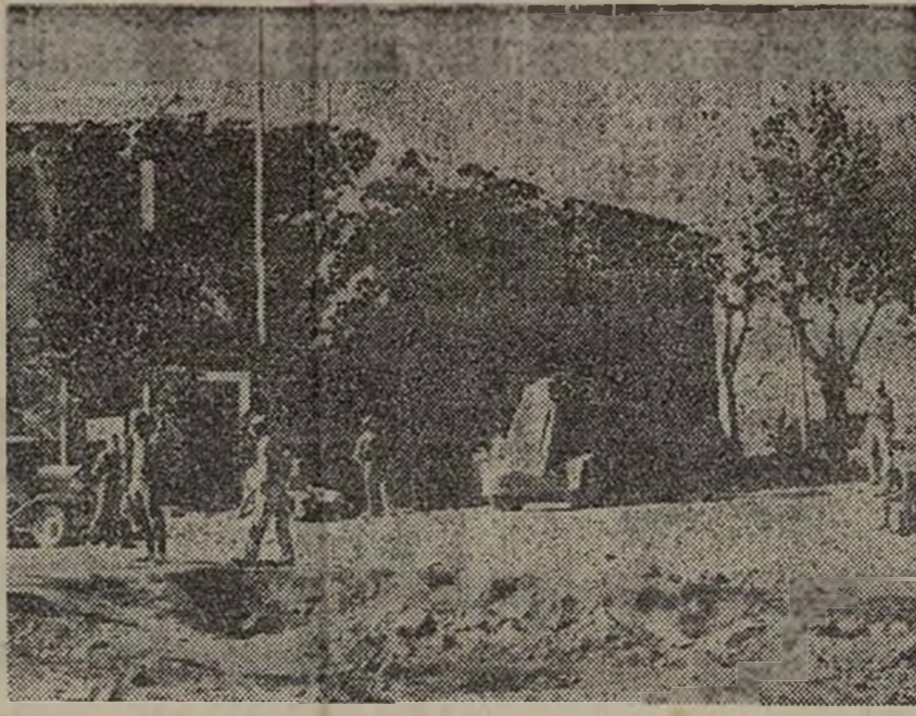
Un nuevo pueblo, un nuevo trozo de tierra española reconquistado en Aragón a los invasores por nuestro glorioso Ejército popular.