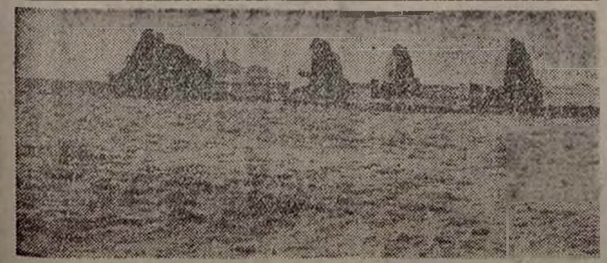
Los carros de asalto del pueblo avanzan por tierras de Aragón.

Además de estos aparatos modernos, la Unión Soviética exhibe en las fiestas nacionales centenares de pequeños biplanos. Es razonable suponer que, además de estos aparatos, existan centenares o miles de aviones modernísimos que no se exhiben para nada y que están en los cuartos de campos de aviación que existen desde Leningrado hasta Vladivostok y a los que no tienen acceso la población civil.—United Press.