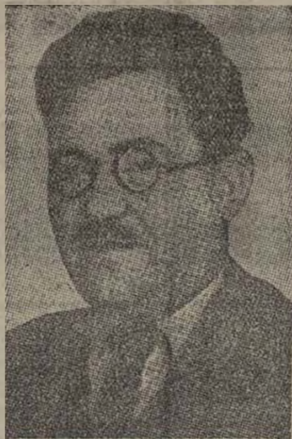
El camarada Benoit Frachon, secretario adjunto de la C. G. T.

París, 24.—La tragedia asturiana ha producido honda emoción en la opinión francesa y un sentimiento de indignación y de protesta. La situación militar de todo el frente Norte era tal, que nadie se hacía ilusiones desde hace seis meses respecto al resultado de la heroica defensa de los luchadores de la República, y en los últimos cincuenta días los combatientes invasores extranjeros tuvieron un número enorme de bajas; pero la situación de un frente de pocos kilómetros de profundidad, situado por fuerzas superiores en número y bloqueado por mar, sin armas ni comunicaciones, era desesperada, habiéndose llegado a esta situación como consecuencia de la política llamada de no intervención, que deja toda la libertad a los agresores y niega la posibilidad de defenderse al Gobierno le-