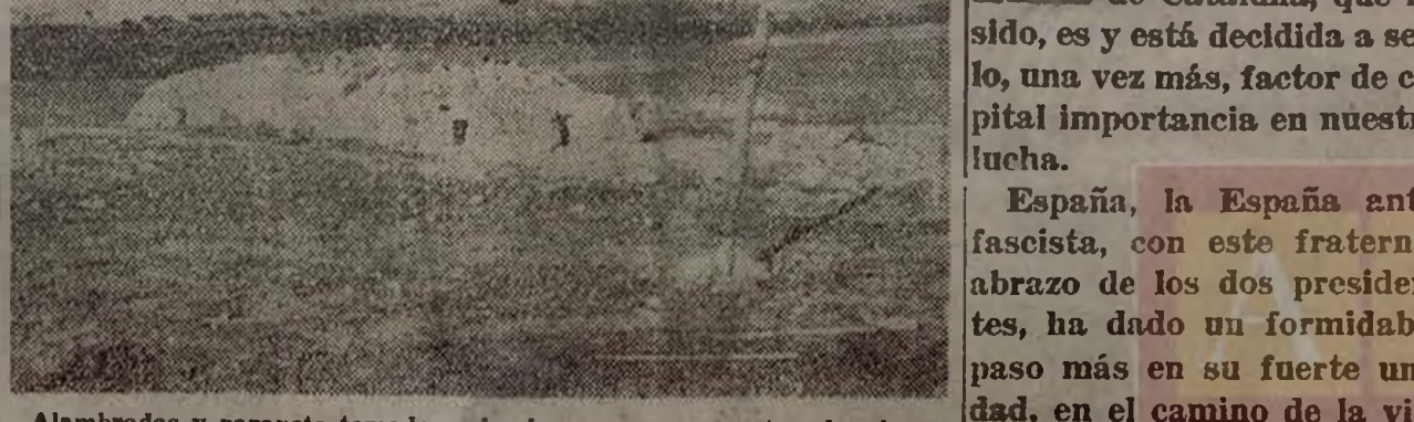
Alambradas y parapeto tomados a los invasores por nuestros heroicos soldados en Aragón.