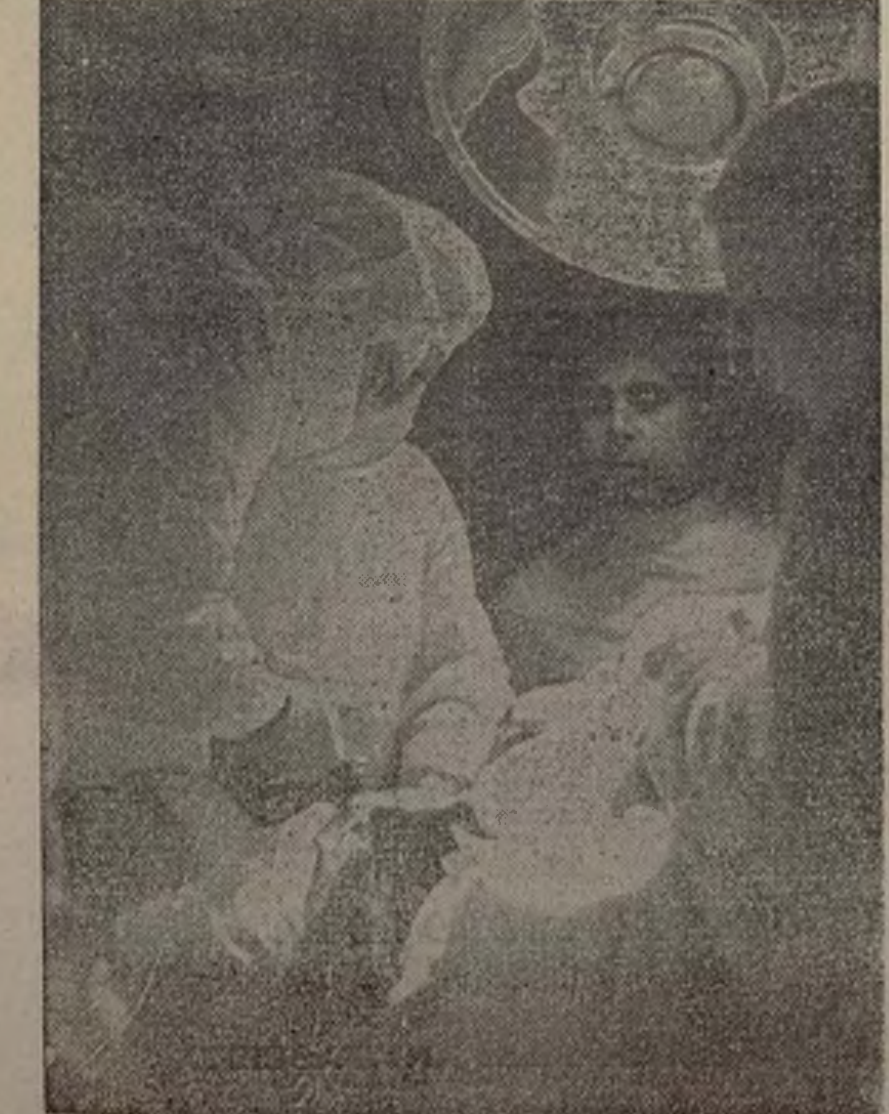
Escena de una operación quirúrgica.