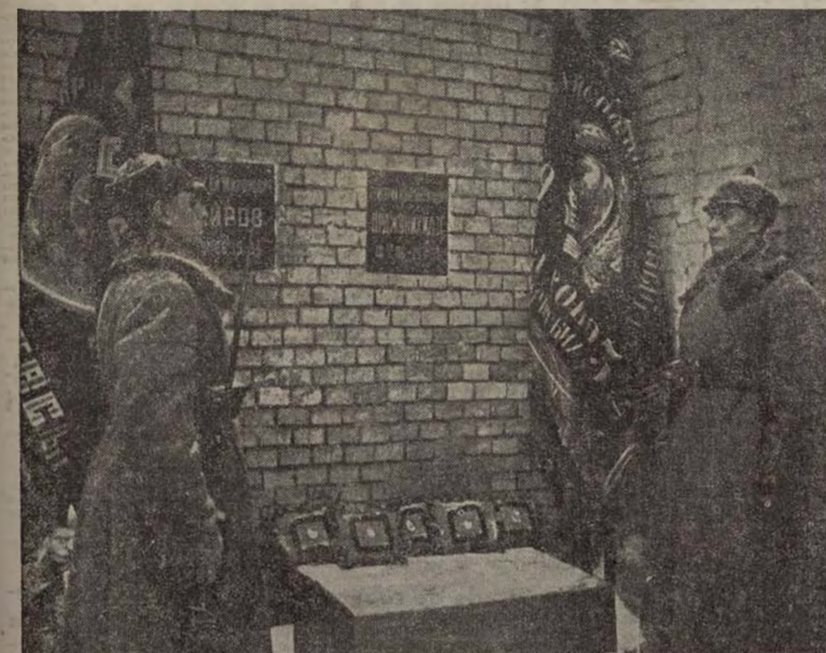
Més de 200.000 obrers de la URSS, representants dels Sindicats d'Empreses, d'oficines dels Instituts Científics i de les unitats de l'Exèrcit soviètic, es reuneixen a la Plaça Roja el dia 21 d'aquest mes, amb motiu de l'enterrament de les cendres del comissari del Poble de la Indústria Pesada, Gregori Constantinovitch Ordjonikidze.