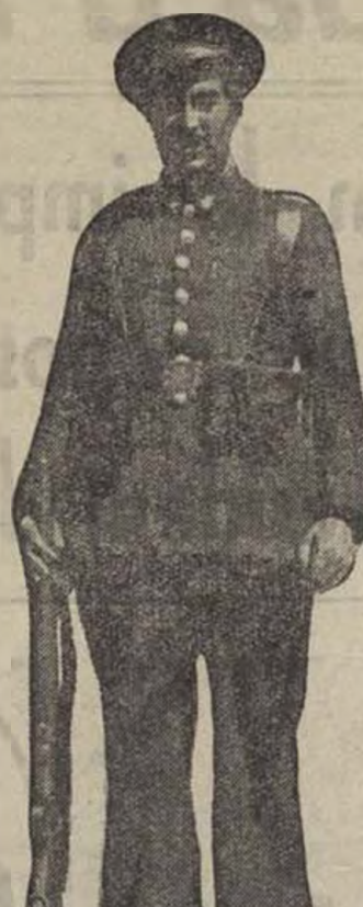
que no hem fugit com a coloms; hem aguantat a peu ferm amb l'entusiasme que en una lluita com aquesta és precis tenir.

El sentit de responsabilitat cal que s'imposi. Els Cossos Ar-