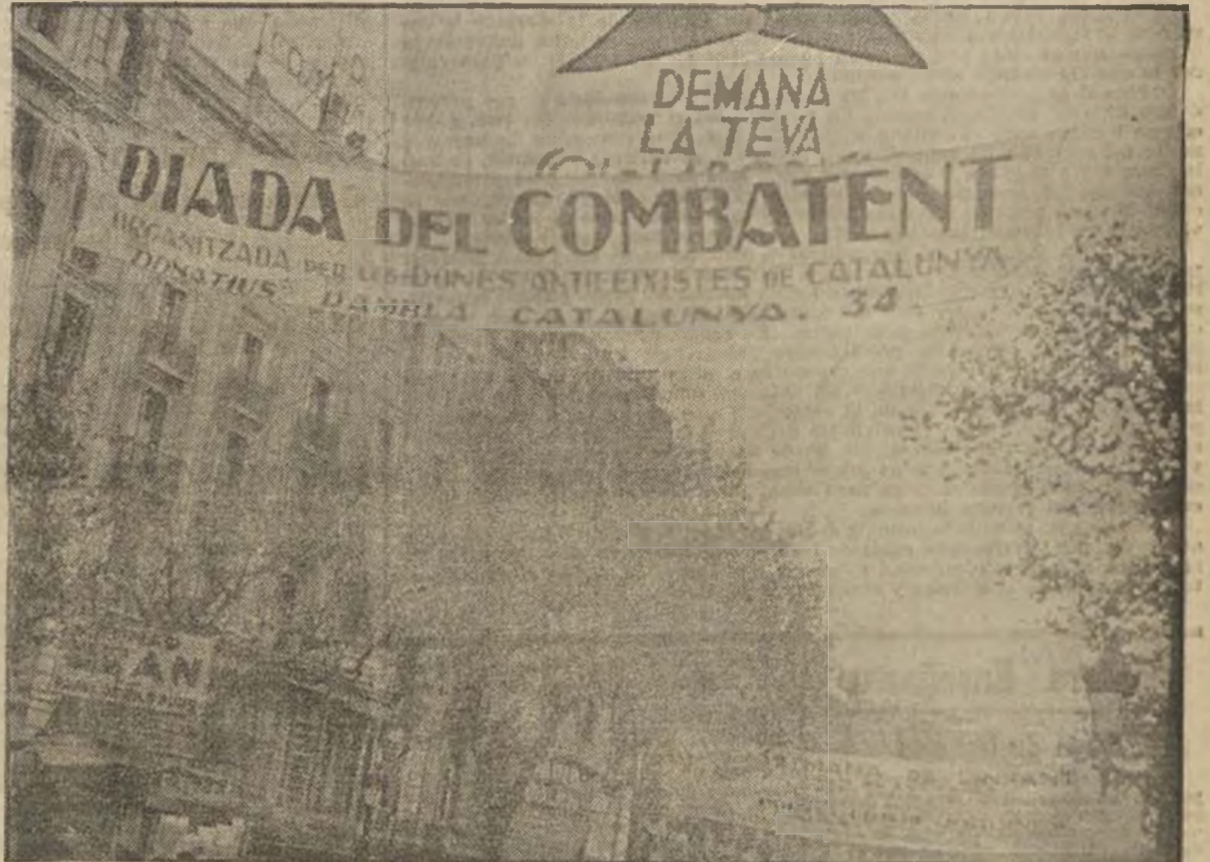
Nuestras típicas Ramblas, en pleno período de efervescencia. Grandes cartelones se alzan sobre las multitudes ciudadanas. Y no son banderas de combate, no son excitaciones a la violencia, no son clamores de odio y de venganza.