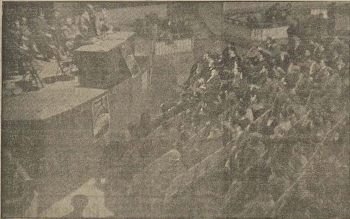
El Socorro Rojo Internacional está realizando una magnífica labor llena de generoso sentido altruista y de espíritu revolucionario.