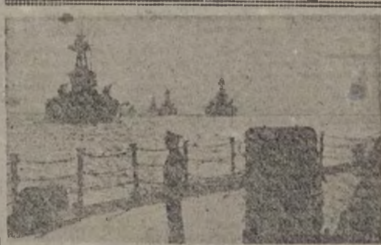
Manobras americanas en el Pacífico

Vuestra gesta es un ejemplo que todos estamos dispuestos a imitar; vuestros compañeros de equipo, que por las mismas causas sufren, sonríen satisfechos ante el deber cumplido, y entre dientes murmuran: «¡Os vengaremos!»—El comisario, F. SALVA.