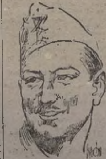
Leopoldo Menéndez, jefe del ejército de Levante, que, al igual que los coroneles Matallana, Jurado y Herrera, ha sido ascendido por el Gobierno de la República a general, y a todos los cuales transmite LA VOZ DEL COMBATIENTE su más justa felicitación.

Finalmente se organizó un desfile ante las autoridades, que resultó muy brillante. (Febra.)