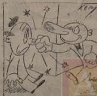
¡Unidad, unidad, para aplastar al ...!