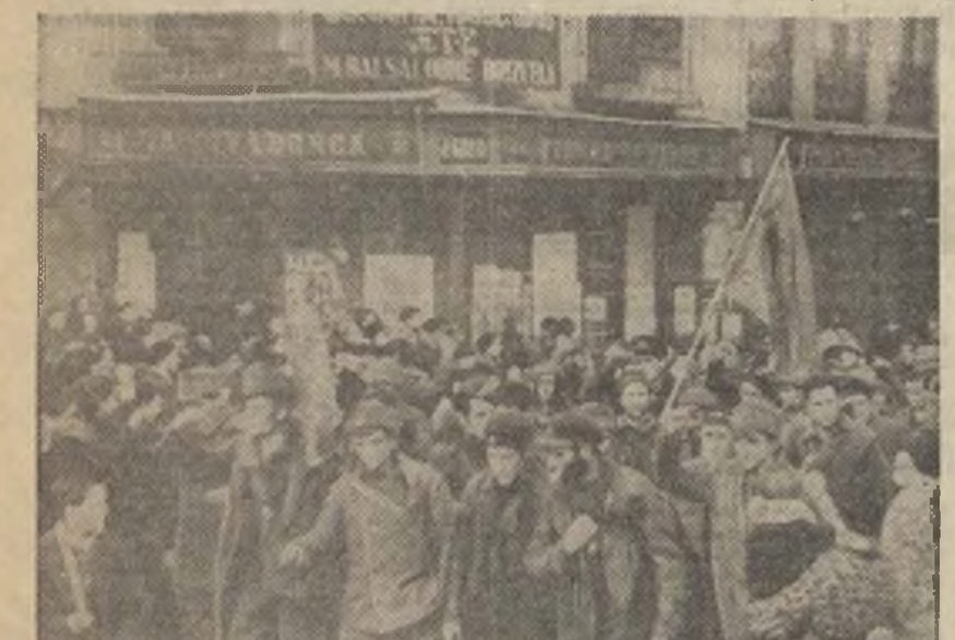
Combatientes de la retirada de Talavera y obreros de las fábricas se juntaron el 7 de noviembre. El pueblo de Madrid supo movilizarse para la defensa de la ciudad.

Ha pasado un año de todo esto. Las casas se encuentran resquebrajadas de las explosiones de los obuses y de las bombas.