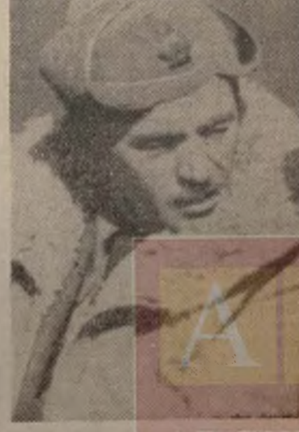
El camarada Hans Beimler, h roe de la libertad de nuestro pueblo