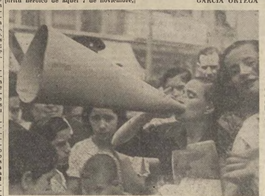
Las mujeres pidieron el puesto de los hombres. Y nuevos combatientes se incorporaron a la defensa de la ciudad.

para repetir la fecha con una gloria aún mayor. Madrid convertirá el heroísmo de cada día en el heroísmo de cada momento.