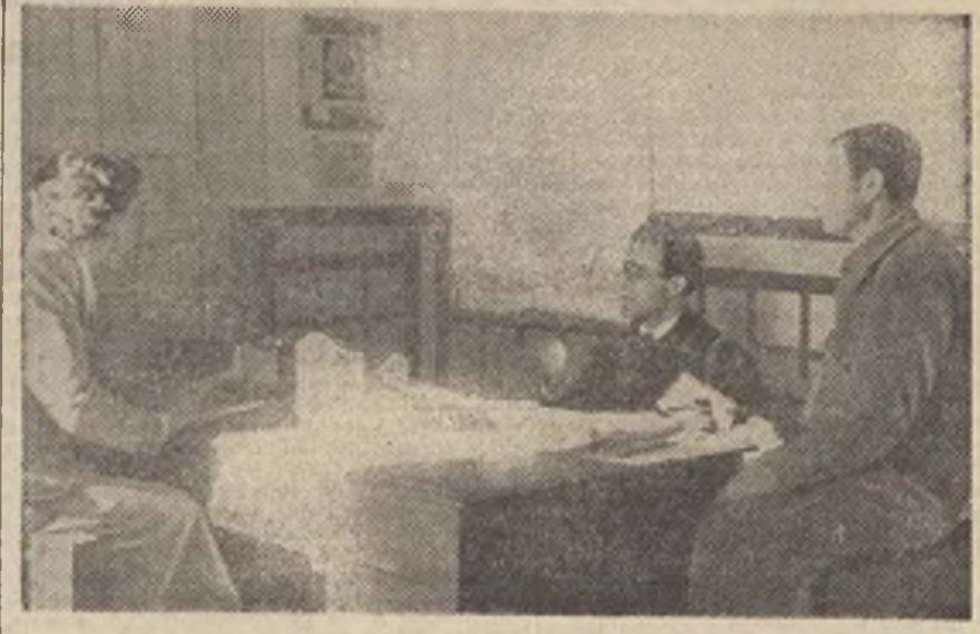
"Hoy contamos ya con 53 refugios, aparte de los que se están construyendo y los que se han hecho por los propios vecinos", dicen los camaradas de la Sección 5.ª de Comités de Vecinos.

La barriada de Cuatro Caminos —casuchas humildes, viejas y agrietadas ya por los temporales— comenzó a ser objeto de los bombardeos de los aviones negros.