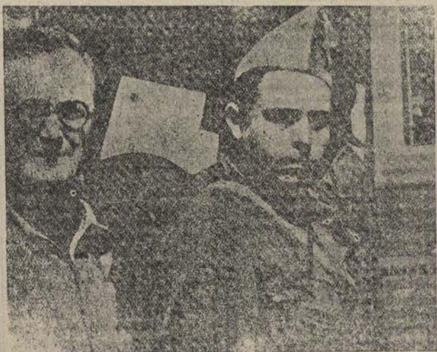
Todo por la causa que fué tu causa. Todo por la guerra que fué tu guerra. A ti, que todo lo entregaste, te debemos todos esta promesa.

Procediendo así nuestra organización tendrá la personalidad