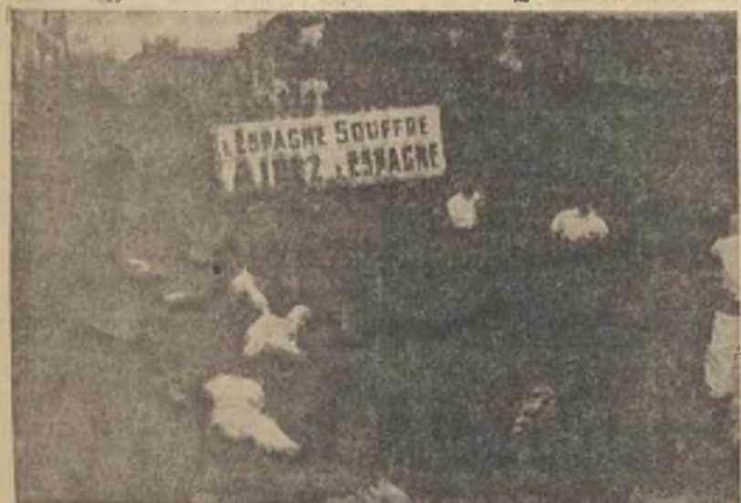
La cabeza de una manifestación y colecta organizada por los obreros belgas de Charleroi en favor de nuestra causa