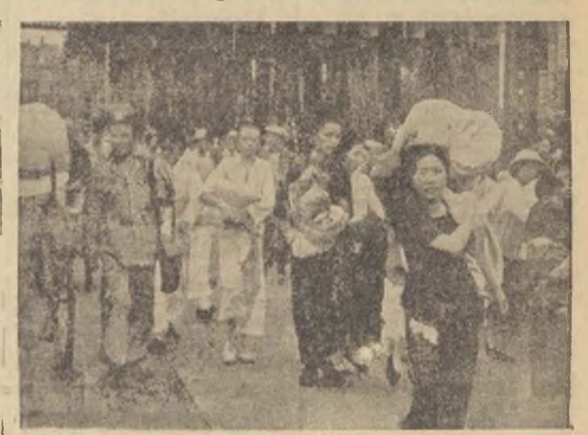
El trágico éxodo de la población china de Shanghai ante la bárbara devastación de la ciudad por la aviación japonesa

TOKIO, 27.—La revista japonesa “Rusia”, simpaticante con el ejército, escribe en su número de Octubre, con el título de “Guerra con China o guerra con Rusia”: “Los soviets no se atreverán a intervenir abiertamente a favor de China, pero lo apoyarán con el fin de desgastar el potencial de guerra japonés con la prolongación del conflicto. La sola contramedida para el Japón es proceder al hundimiento de la falsa China del Kuomintang y concluir un pacto anticomunista nipo-chino con el nuevo Gobierno verdaderamente chino que sustituirá a la administración de Chang-Kai-Shek. El pacto anticomunista nipo-alemán no ha tenido hasta ahora su pleno efecto, puesto que ha fracasado por la oposición de los círculos intelectuales y financieros del Japón. Es necesario reforzar el pacto que es el preámbulo a la alianza italo-germano-japonesa. Inglaterra deberá abandonar, entonces, su actitud pro-soviética e incluso—si ella persiste— el Japón no temerá el malhumor de la potente Inglaterra. Lo esencial para el Japón es