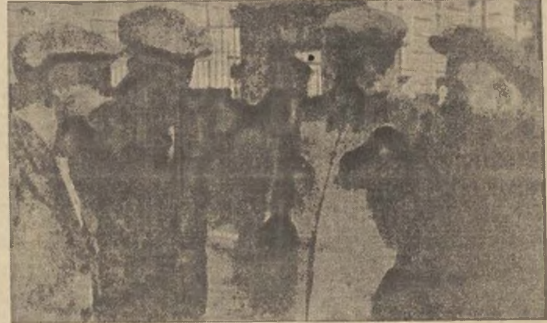
La Jornada Internacional de la Juventud ha tenido en la U. R. S. S. un extraordinario relieve, tanto por su volumen como por su significación, que dió lugar a que de nuevo se pusiera de manifiesto la solidaridad del pueblo soviético con la causa de la España republicana. En el grabado, Kossarev, Bulgárin, Dimitrov y Cruschthoff, en el patio del Kremlin, después de la manifestación, comentan sus impresiones de su importancia.