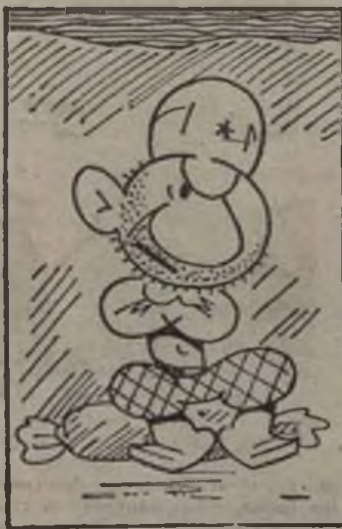
De sector quiere cambiar, y así su amor olvidar.