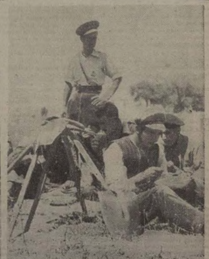
La hora de la calma. Este grupo de bravos zapadores se mantiene tranquilo, bajo la mirada de un oficial que inspecciona el rancho a fin de que éste esté siempre en las mejores condiciones.

TERUEL.—Ligero fuego de fusil y ametralladora. Se ha protestado en nuestras filas un evadido.»