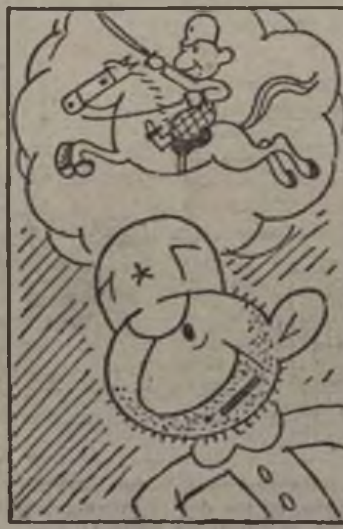
Solicitando un buen día pasar a caballería.