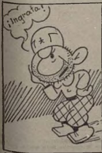
Tiene, por lo que ha pasado, el corazón destrozado.

Hay que evitar ser tan bruto como el soldado Canuto