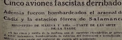
Huellas de la civilización fascista.