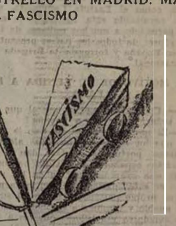
Huellas de la civilización fascista.