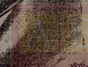
Huellas de la civilización fascista.

Las gloriosas hazañas de nuestra Aviación Cinco aviones fascistas derribados Además fueron bombardeados el arsenal de Cádiz y la estación férrea de Salamanca