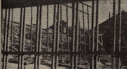
Huellas de la civilización fascista. (Foto Mayo).

El enemigo repite sus fuertes ataques a Madrid. Han arreciado en el sector del Puente de los Franceses. Pero nuestros milicianos rechazan sus ataques y paran sus tanques. La consigna es no retroceder ni un palmo.