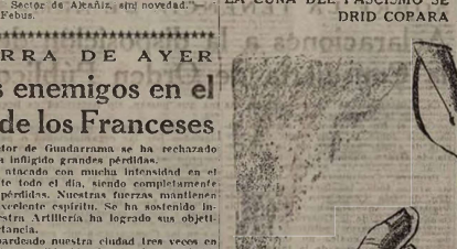
Huellas de la civilización fascista.