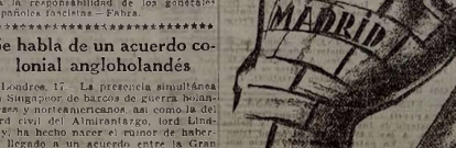
Huellas de la civilización fascista. (Foto Mayo).