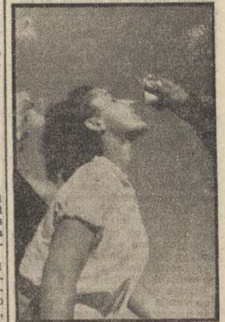
Terminada la prueba, las participantes se reponen

Fue suspendida la sesión del Price. El matinal anunciado para el domingo, fue suspendido. Oportunamente se fijará la fecha, para su celebración con arreglo al programa anunciado.