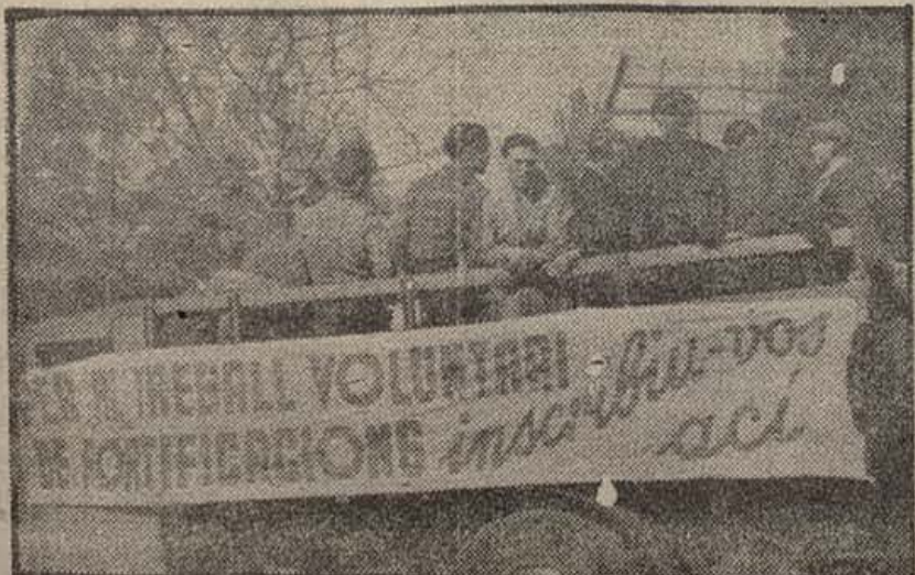
El material para las fortificaciones