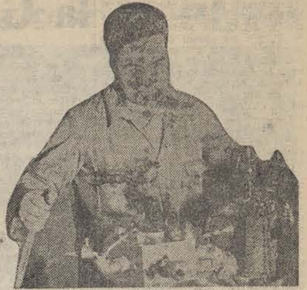
Los trabajadores ponen en su labor la misma atención que nuestros soldados en el manejo de las armas. Y la mejor correspondencia a su esfuerzo es hacer que no se pierda la eficacia de los hombres y las máquinas, coordinando toda la industria en un solo organismo oficial

E l manifiesto del Partido Socialista Obrero, del Partido Socialista Unificado de Cataluña, de nuestro Partido y de la Unión General de