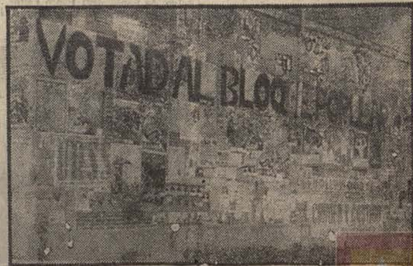
Vísperas del triunfo. Un cartel que llenaba todo el país

Si lo sabía. Podían preguntárselo a los nuevos presos de toda España. Los nuevos presos eran aquellos sindicatos, en la cárcel con motivo de