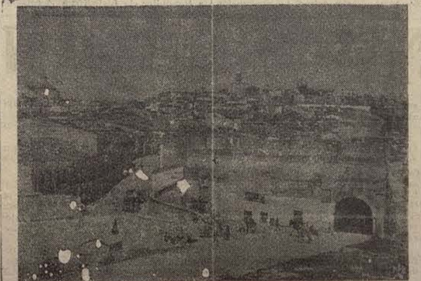
Se ha producido un levantamiento en Badajoz y en diferentes pueblos de la provincia contra Franco. En la ciudad tuvieron efecto sangrientos choques. Una vista de la ciudad de Badajoz