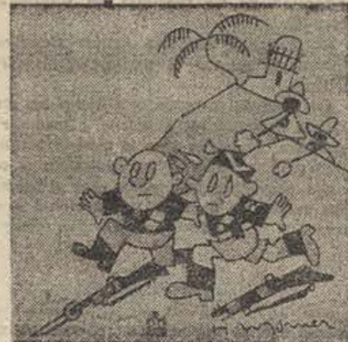
—¡Esos salvajes no parecen tener más prisa que los países democráticos en el reconocimiento de nuestro imperio! (Dibujo de Monier) (A.I.M.A.)

Salen de Addis-Abeba contingentes de tropas para las regiones sublevadas