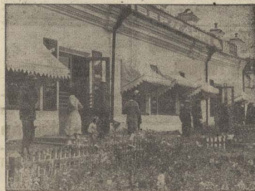
En las cumbres del Lena, en lugar de las antiguas barracas del régimen capitalista, el Poder soviético ha hecho construir escuelas, teatros, clubs, hospitales y magníficas viviendas.

1.128, en los cuales, el rendimiento en especies llega de medio a un millón de rublos. En 1935, habían tenido 80 kolkhoz millonarios, y actualmente cuenta con 337.