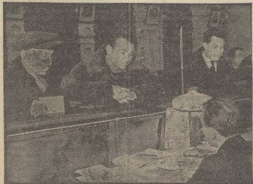
Los delegados venidos de todos los rincones de la U.R.S.S. se hacen anotar en el registro (A.I.M.A.)

Hoy tarde, a las cuatro, a pala: AZURMENDI - UNAMUNO contra AZPIOLEA - JAUREGUI. Noche, a las diez y cuarto, a pala: GALLARTA III - PEREA contra NARRU II - IZAGUIRE I.