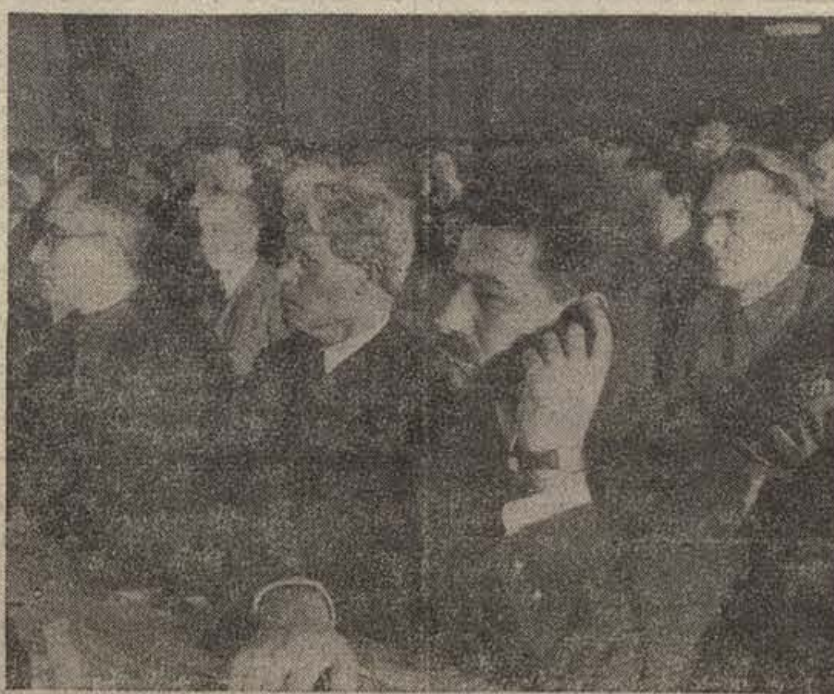
MOSCÚ.—Diputados del Azerbaidján en el Consejo Superior de los Soviets. (El segundo de la derecha es el académico Gubkino)

De los veintidós millones de km. cuadrados con que cuenta el país soviético la República Federativa de Rusia tiene 16,5 millones de km. cuadrados. De 163 millones de habitantes, 10,5 millones viven en el territorio de la Federación rusa. Los mayores centros industriales, la mayor parte de las empresas industriales, las más potentes fábricas de la industria del automóvil y de los tractores y de aviones se encuentran en su territorio. Por razón de su situación en el centro de la Unión Soviética, de su importancia cultural y económica de primer orden, la Rusia Soviética se ha convertido en la capital de la alianza fraternal de la Unión Soviética. Es querida por todos los pueblos de la Unión Soviética como asimismo de los trabajadores de todo el mundo. Las estrellas rojas del Kremlin en Moscú brillan en todo el país soviético y en el mundo entero. En la Unión Soviética no existe separación entre el «centro» y las regiones exteriores, no existe separación entre la metrópoli y las colonias.