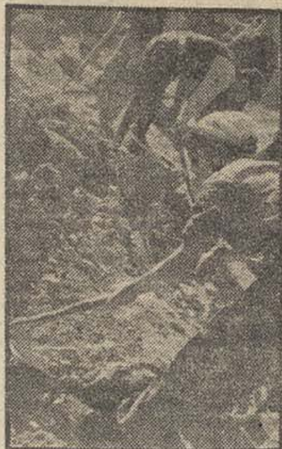
Un momento más, por la victoria!

dedica los domingos a fortificar nuestras costas y construir refugios