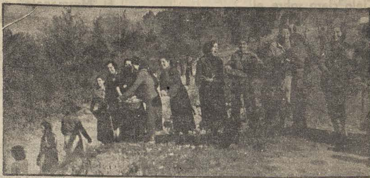
El trabajo abnegado de los que comprenden su deber

—He aquí un espejo para que se miren los defensores de la semana inglesa.