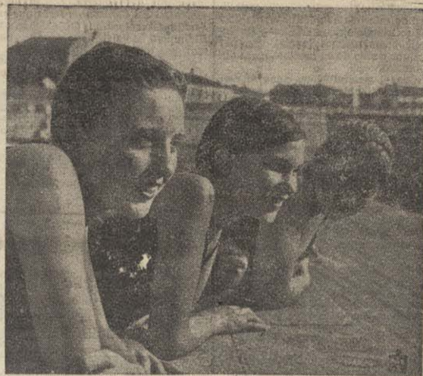
Jóvenes nadadores—fuertes y alegres—del pueblo soviético

En 1936, el rendimiento en especies de los kolkhoz ouzbeki era de 2.400 millones de rublos, contra 343 millones en 1933. El Uzbekistan cuenta con