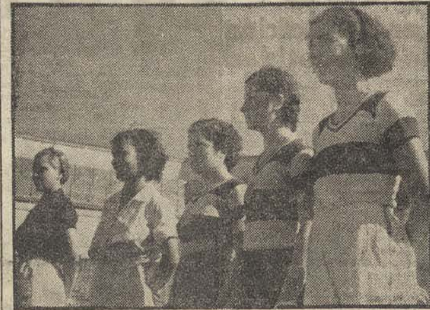
Las participantes esperan, tranquilas y confiadas, la señal de salida