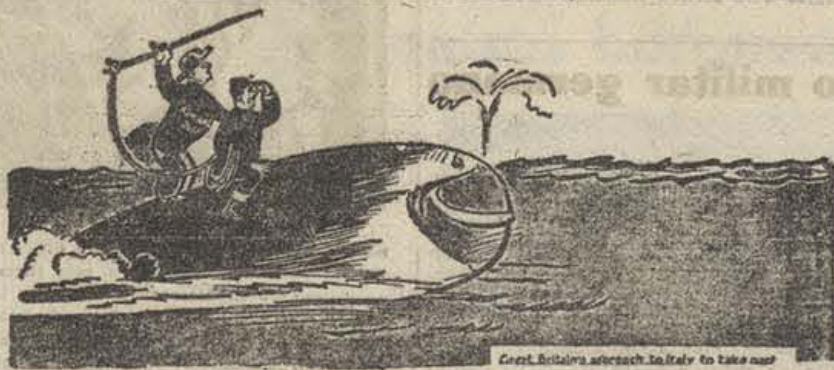
PESCA DE CETACEOS EN EL MEDITERRANEO El almirante británico.—Es extraño. Ahora no se ve ninguna ballena

Además de las consignas oficiales, figuraban en los transportes la reclamación inmediata de la apertura de la frontera francoespañola y el boicot al Japón.—A. I. M. A.