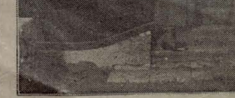
El señor Aguirre, después de verificar el escrutinio para el cargo de presidente, agradece su designación y su cargo de presidente del Gobierno provisional de Euzkadi.

El gobernador civil de la provincia pronunció un discurso, en representación del Gobierno central, y a continuación el señor Aguirre agradeció, en emocionadas palabras, la honrosa distinción que se le concedía. Hizo resaltar sus sentimientos cris-