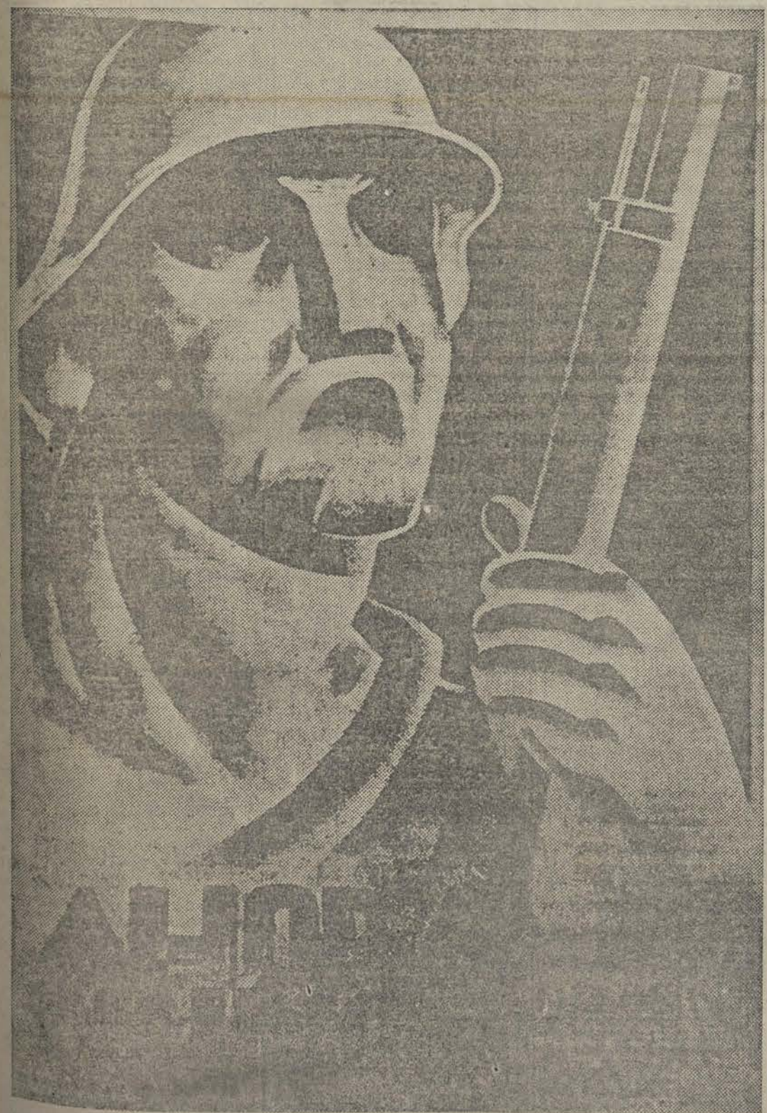
"Ahora o nunca", dice este cartel fascista recogido en uno de los frentes de lucha, y los soldados del Ejército popular, con su ofensa va desde Madrid, deshacen el dilema y gritan esta afirmación: ¡Nunca!

Después de hacer las separaciones que señalamos como necesarias, es preciso robustecer la autoridad antifascista dentro de las cárceles, y para esto no creemos que sea necesaria la violencia. A nuestro entender, bastará con que los directores de las cárceles, en vez de ser funcionarios sin significación en la lucha antifascista, sean representantes de las Organizaciones y de los Partidos.