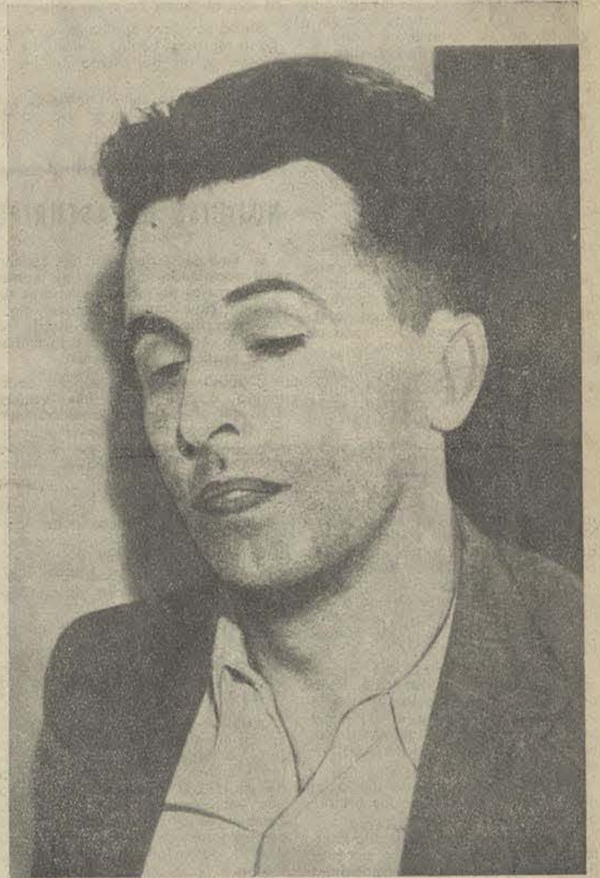
Prestes en la prisión donde aguarda el proceso que empezará estos días.

"Vosotros sabéis que en el Brasil hay un hombre, Prestes, que está en la cárcel, al que se quiere juzgar sin las debidas garantías que debe tener todo proceso. Los aquí reunidos reclamamos que se le den toda clase de libertades para demostrar su inocencia o su responsabilidad. Recordad que en España se han verificado ejecuciones sin procedimiento. Todos estamos dispuestos a pedir que se le garanticen los procedimientos para probar su inocencia".