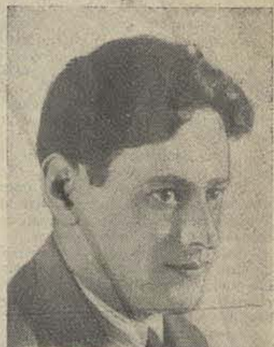
RODOLFO GHIOLDI, Secretario del Partido Comunista Argentino, miembro del Comité Ejecutivo de la I. C., exilado político en el Brasil, detenido y torturado por la sangrienta dictadura de Vargas. ¡Exigid su libertad!

¡Mujeres! Vosotras debéis colocaros incondicionalmente al lado de Anna Pauker y de todas las víctimas del fascismo internacional. En los trágicos días de octubre, recibimos el cálido aliento de los antifascistas de todos los países. Ahora debemos ser nosotros los que acudamos en su auxilio.