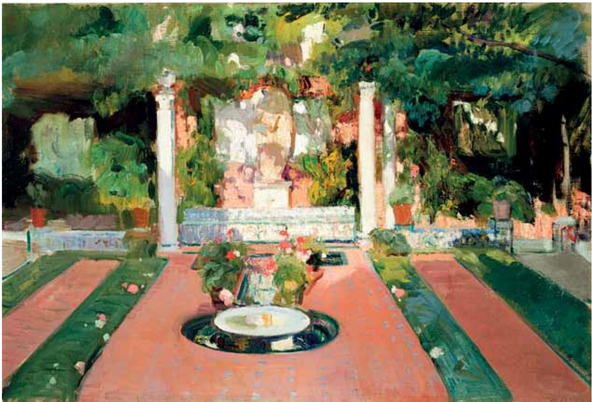
Joaquín Sorolla Jardín de la Casa Sorolla 1918-1919 Núm. de inv. 1235