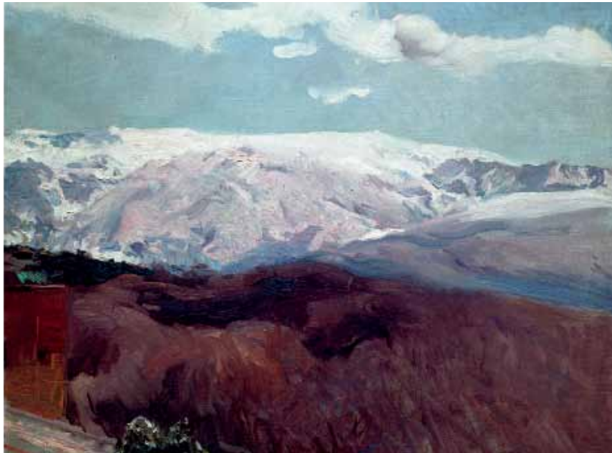
Joaquín Sorolla Sierra Nevada en invierno 1910 Núm. de inv. 867