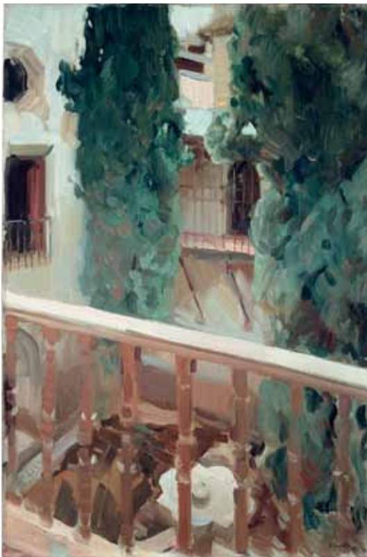
Joaquín Sorolla Patio de Dña. Juana de La Alhambra de Granada 1910 Núm. de inv. 861