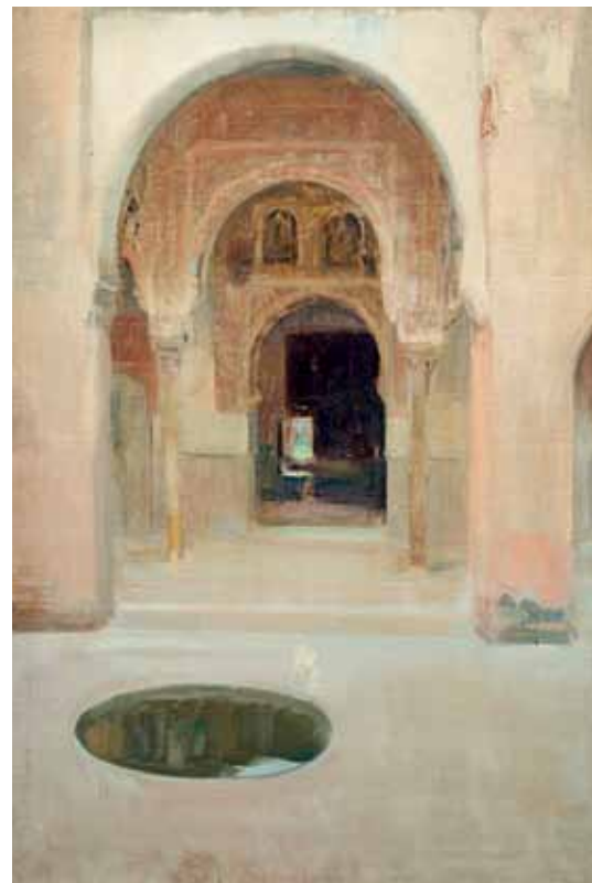
Joaquín Sorolla Patio de la Alhambra Granada 1917 Núm. de inv. 1148