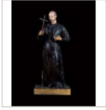
Juan Martínez Montañés (1568-1649) y Francisco Pacheco (1564-1644) San Ignacio de Loyola , 1610 Madera policromada y tela encolada, 173,5 x 70 x 55 cm Iglesia de la Anunciación, Universidad de Sevilla