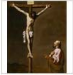
Francisco de Zurbarán (1598-1664) San Lucas como pintor, ante Cristo en la cruz , 1630 - 1639 Óleo sobre lienzo, 105 x 84 cm Museo Nacional del Prado, Madrid