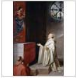
Alonso Cano (1601-1667) La visión de San Bernardo de Claraval , también conocido como El milagro de la lactancia , hacia 1657-60 Óleo sobre lienzo, 267 x 185 cm Museo Nacional del Prado, Madrid