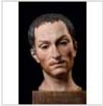
Alonso Cano (1601-1667) San Juan de Dios , hacia 1660-5 Madera policromada y cristal, 30,5 x 22 x 21 cm Museo de Bellas Artes, Granada