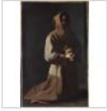
Francisco de Zurbarán (1598-1664) San Francisco en meditación , 1635-9 Óleo sobre lienzo, 152 x 99 cm The National Gallery, Londres