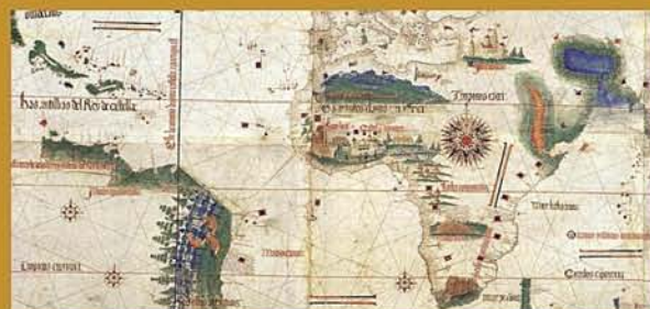
Carta portuguesa del Cantino. 1502

The Treaty of Tordesillas is the first in the history of Hispanic America: the meridian will later affect the eastern lands of the said continent, especially Brazil; nevertheless in 1494 the signatories were not aware of the significance and far reaching nature of their act which really implied the sharing out of a world not yet reached or known by the Europeans: Columbus in his second voyage had not yet discovered the continental coasts of the New World.