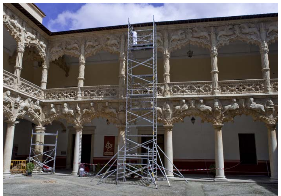
El Patio de Leones durante la restauración.