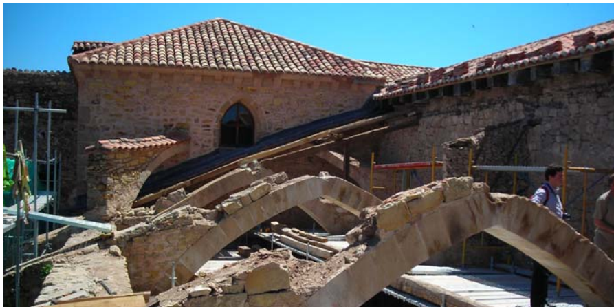
Catedral de Sigüenza: Panda norte del claustro: obras en las cubiertas

ción de la panda norte del Claustro cuyo espacio original se encontraba muy compartimentado y en muy mal estado. Esta actuación, que inicialmente estaba contemplada con cargo al 1% Cultural, ha sido ejecutada íntegramente por el IPCE: Consolidación estructural de las fábricas, rehabilitación de las cubiertas, excavación arqueológica del interior que ha permitido documentar y exponer el acceso al claustro de época románica, recuperación del espacio original y su acondicionamiento para uso museístico de la Catedral.