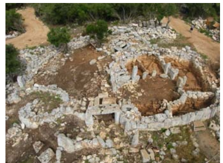
Círculo de Cartailhac en el transcurso de la excavación