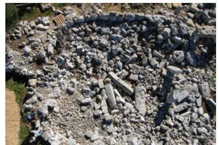
Círculo de Cartailhac antes de la excavación