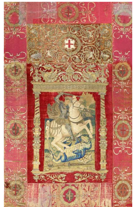
Detalle del "Repostero" de San Jorge.

Proyecto y dirección técnica: Pilar Borrego