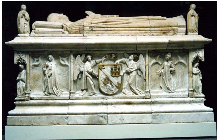
El sepulcro después de la restauración

sufría la obra y como medida para disimular desperfectos y suciedades, aplicaron una capa de pintura negra al hábito. A lo largo del tiempo se sucedieron los repasos sobre ésta, que llegó a ser tomada como original. Incluso se ha localizado un repinte hecho cuando la obra ya se encontraba en el Museo Arqueológico Nacional a principios del siglo XX.