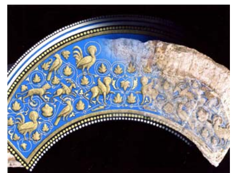
Reconstrucción digital de uno de los arcos aparecidos en las excavaciones