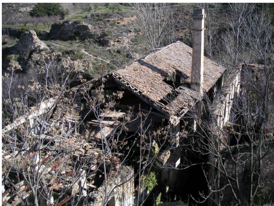
Detalle de la Fábrica Els Solers antes de la restauración