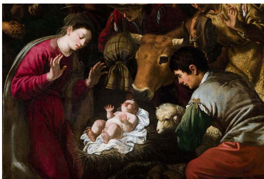
Detalle de la Adoración de los Pastores, de Angelo Nardi, después de la restauración

En junio de 2008 finalizó la restauración de las seis pinturas de los retablos localizados en cada una de las capillas radiales de la iglesia del Monasterio de San Bernardo, en Alcalá de Henares (Madrid), fundado por D. Bernardo Sandoval y Rojas. Representan un interesante conjunto del barroco madrileño cuyos temas son: Ascensión , Circuncisión , Adoración de los Magos , Resurrección , Asunción y Adoración de los Pastores . Junto con las del presbiterio, fueron contratadas por Ángelo Nardi en 1619 y están firmadas y fechadas al año siguiente. Son cuadros de gran formato rematados en arco de medio punto, cuyo soporte es la tela imprimada, montados sobre tableros de madera. Durante la Guerra Civil fueron incautados y llevados al depósito provisional del Museo del Prado y una vez finalizado el conflicto bélico se devolvieron al monasterio.