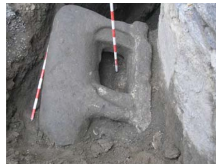
Murallas de Ávila. Verraco recuperado en la Puerta de San Vicente