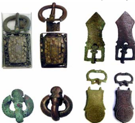
Fibulas y broches de cinturón de "El Carpio de Tajo"