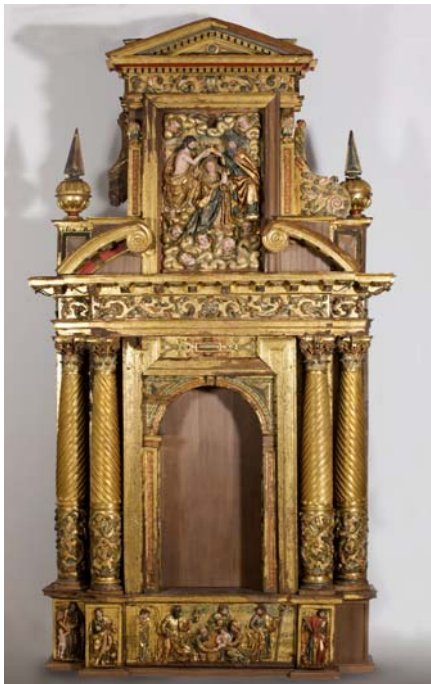
Recomposición del retablo menor de Oteruelo (dimensiones 386 X 175 cm)