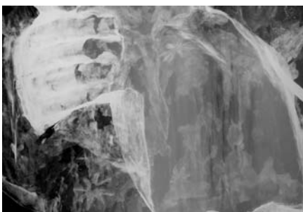
Detalle del estudio de las imágenes mediante RX, donde puede apreciarse motivos de estrellas ocultas bajo las capas de policromía de una virgen gótica