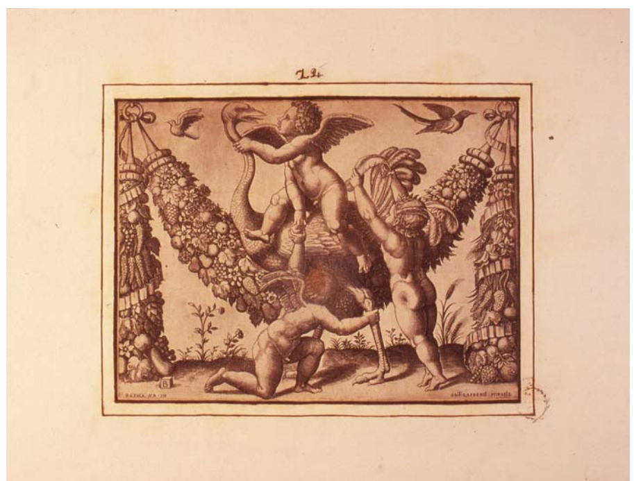
Estampa de Marcantonio Raimondi