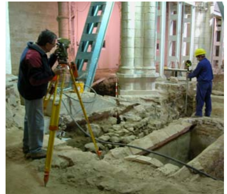
Excavaciones arqueológicas en el interior de la Catedral de Tarazona