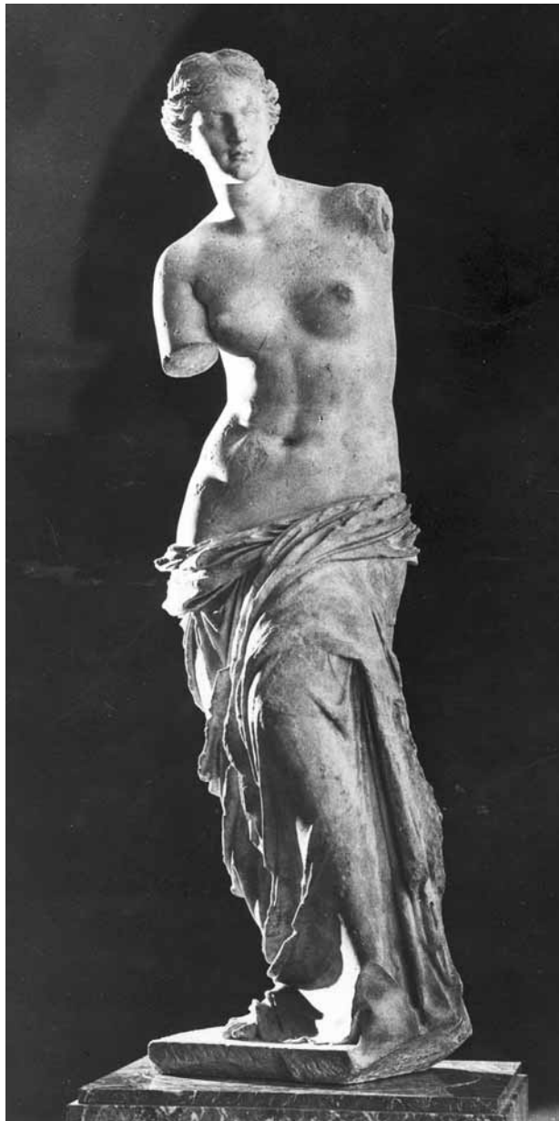
5. Venus de Milo . Siglo II a. C..

-pero que también distancia-, a La Pietà de Miguel Ángel para evitar que un desaprensivo pueda -de nuevo- agredir la fantástica escultura (figura 4).