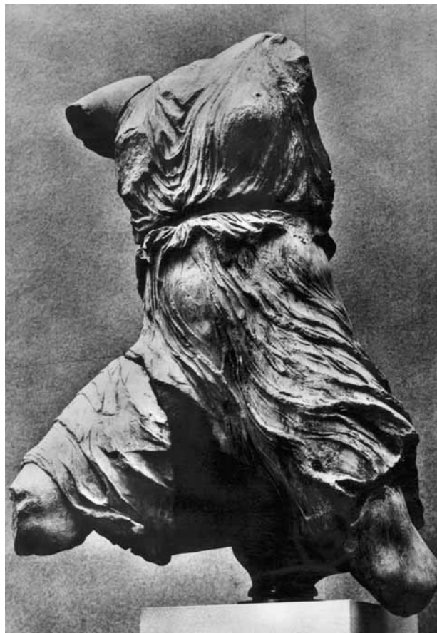
17. Iris , escultura procedente del Partenón, c. 435 a. C. British Museum.

secuencia, algunas obras escultóricas se han sacado de su contexto: no se presentan a la altura donde se preveía que fueran instaladas, y por ello posiblemente el autor había modificado las proporciones. Si se había previsto que se instalaran en un lugar alto con un escorzo forzado, probablemente se esculpían con partes desproporcionadas para que en su lugar de destino su visión fuera la correcta (figura 17). En este caso, instalar las piezas fuera de contexto puede ayudar a potenciar su valor didáctico. En contraste con la exposición de los óleos y los dibujos en donde la altura recomendada de colocación es la de situar el eje de la obra a 150 cm del suelo; esto es, al nivel de los ojos del visitante medio. En la presentación de la escultura esta altura es muy variable y depende de las sensaciones estéticas que la pieza proporciona.