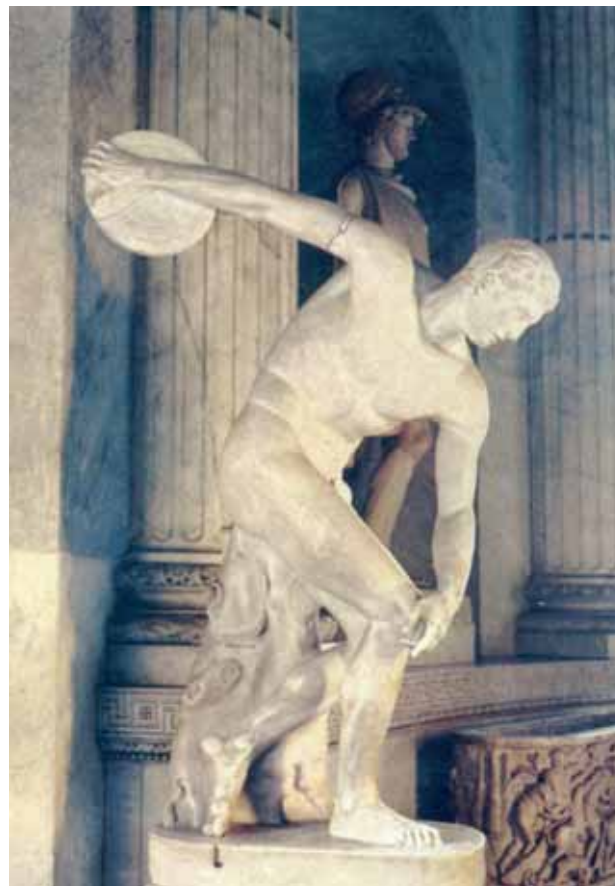
14. Mirón, Discóbolo , c. 450 a. C. Museos Vaticanos.

factores potencien el significado y valores plásticos de la obra. Aún cuando el fondo fuera de un tono similar al de las propias esculturas, éstas destacarían por su volumen, cuestión que no ocurriría si exponemos otro tipo de pieza pues ésta podría empastarse en exceso con su entorno, y se neutralizarían muchos de sus valores plásticos