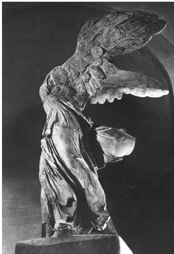
12. Victoria de Samotracia , siglos III-II a. C. Museo del Louvre.

valores decorativos desplazan, en cierta medida, a aquellos otros relacionados con su volumetría. Además, por regla general son piezas de tamaño reducido que requieren de una visión cercana y donde el detalle cobra gran importancia.