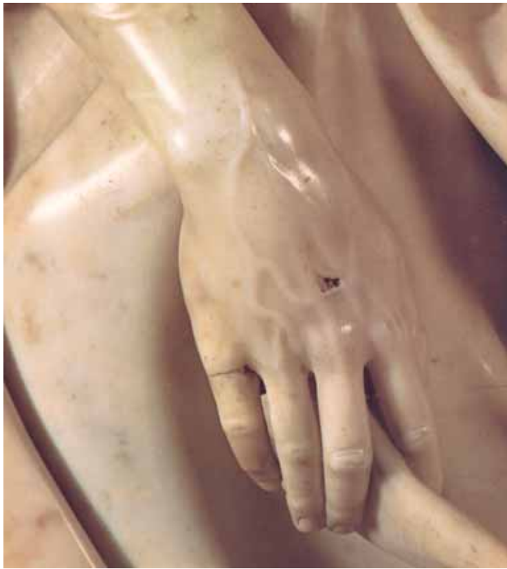
4. Miguel Ángel. Detalle de La Pietà .