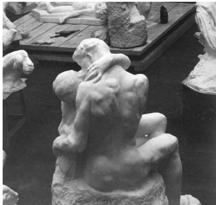
2. Taller de Auguste Rodin, 1904 (Foto: AA. VV., 1999).

La obra escultórica se encuentra especialmente ligada a la arquitectura. Probablemente es el arte con el que comparte más elementos y variables comunes en el proceso de gestación, y en muchos casos en la propia materialización (figura 1). Por otro lado, muchas de las obras escultóricas que se exhiben en los museos estaban pensadas en su génesis para que tuvieran una cercana y estrecha relación con espacios arquitectónicos.