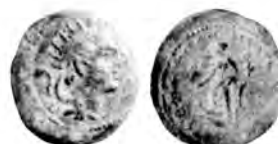
6 Lindgren III 1041