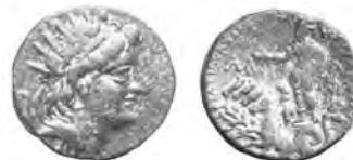
15 AHNS 639