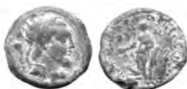
5 AHNS 638