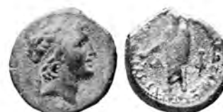
9 CSE 708