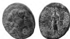
14 Coll. N. Nohra