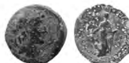
12 Coll. privée (Liban)