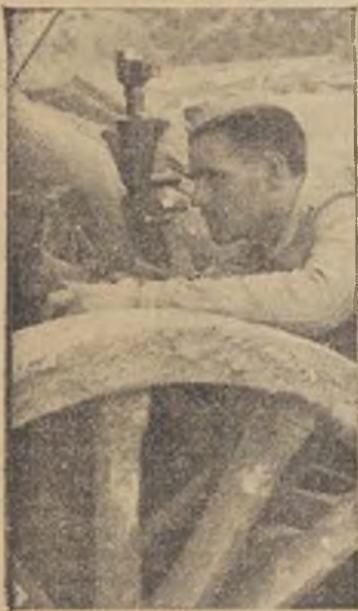
MAXIMA ATENCION. AL ENEMIGO HAY QUE DARLE GOLPE TRAS GOLPE. HASTA DESHACER SU FUERZA