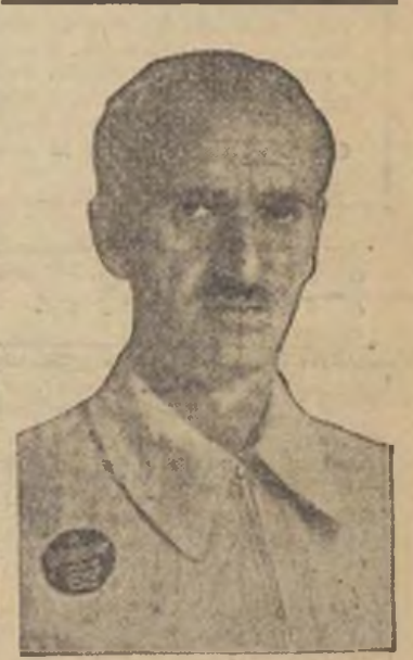
El coronel Hidalgo de Cisneros

Rendimos hoy homenaje a toda la aviación española en la persona de su jefe, el coronel Hidalgo de Cisneros. La potencia de la aviación española ha sido posible por la conjunción del esfuerzo de los bravos aviadores, dirigidos por jefes de la capacidad organizadora, conocimientos técnicos y lealtad pura de su jefe. Algún día, cuando expulsemos de España a los invasores extranjeros, podrá darse a conocer cómo se ha trabajado, cómo se ha luchado y las dificultades que se vencieron y se vencen para, de aquellos «Breguet» anticuados e inútiles, llegar a poseer una aviación, muy inferior en número de aparatos y elementos, pero notablemente superior en calidad, de material y de mandos.