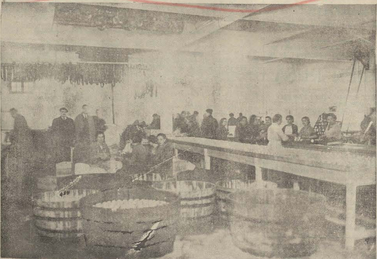
Una vista parcial del interior de la charcutería basca, al servicio del ejército popular antifascista.

¿La muerte? ¿Es que por temor a ser fusilados pueden dejar la voz del Señor? ¿Entonces, qué clase de sacerdotes son esos? ¿Es que prefieren vivir en este valle de lágrimas que sentarse a la Diestra de Dios Padre? ¿No será que están de acuerdo con los fascistas y en contra de nosotros? Creemos que sí.