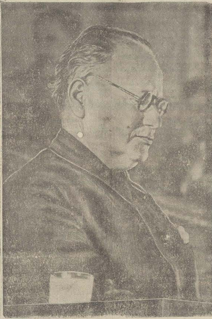
El habilísimo diplomático de los Soviets, camarada Litvinof, pronunciando un discurso en el VIII Congreso extraordinario de la U. R. S. S., en el que se ha plasmado en una realidad venturosa la sociedad sin clases en el territorio soviético.

Praga. — El número de combatientes enviado por Berlín a España asciende a 47.000 hombres, y las cantidades inventadas por Hitler en ayuda de Franco pasan de 500 millones de marcos.