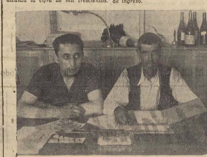
EL PRESIDENTE DEL SINDICATO AGRICOLA DE UTIEL DESPACHANDO CON EL ENCARGADO DE LA SECRETARIA