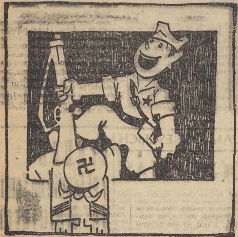
EL PUEBLO ESPAÑOL, UFANO, LIBRE YA DE LA ESCLAVITUD, IRA A VER LA EXPOSICION DE TODA LA JUVENTUD.