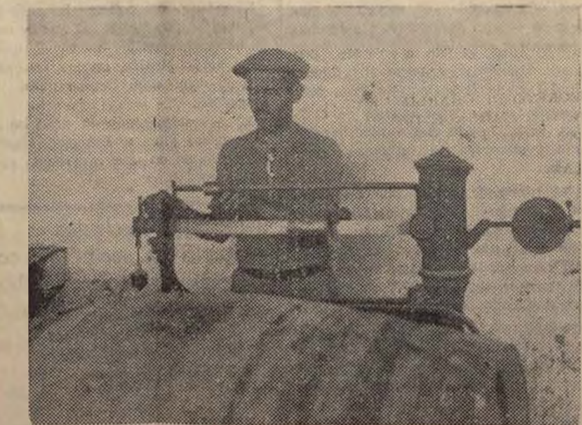
PESAJE DE LAS CURAS QUE LLEGAN A LAS RECTIFICADORAS, POR EL QUE SE SABE LOS LITROS QUE CONTIENE

Al Sindicato Provincial de Profesoras de Corte y Confección U. G. T.