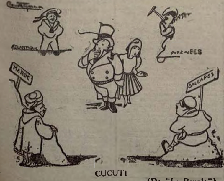
CUCUTI (De "Le Peuple")