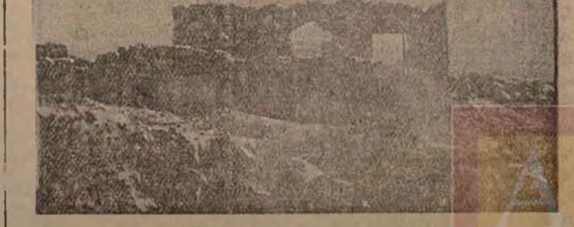
Esta casa, conocida por el nombre de "Casa destruida", y que corona la trinchera de la muerte, ha sido conquistada por los soldados de la República que luchan en Uscera (sector Centro)