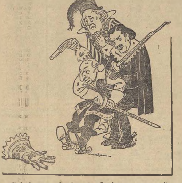
—El fascismo nos echa el guante. ¡Cogedme... o voy a cometer una acción!

LA CRISIS BELGA Spaak ha aceptado el encargo BRUSELAS, 5.—El señor Spaak ha aceptado definitivamente el encargo de formar Gobierno.—Fabra.