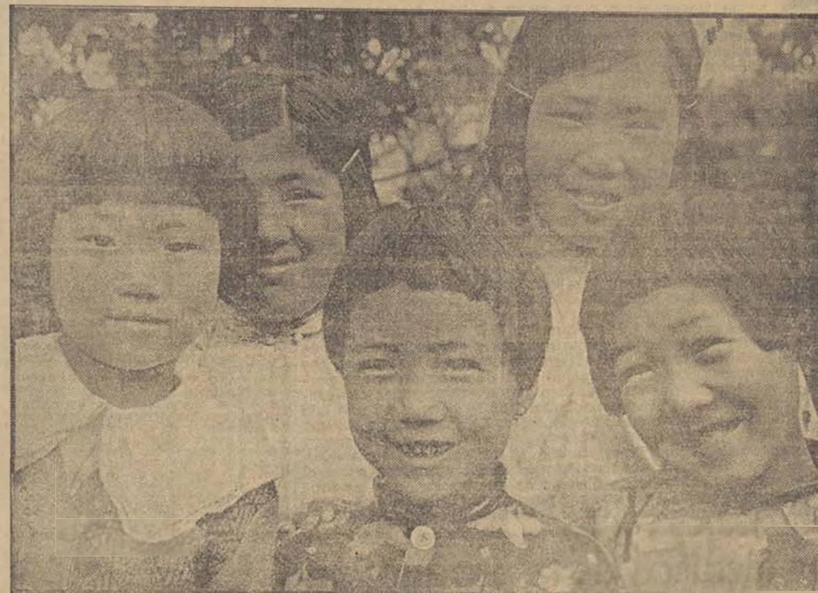
La sonrisa de estos niños de la U. R. S. S. traduce toda la solícita atención de que son objeto bajo un régimen que da satisfacción a las características físicas y morales de su edad y les prepara como eficaces colaboradores de la gran obra colectiva