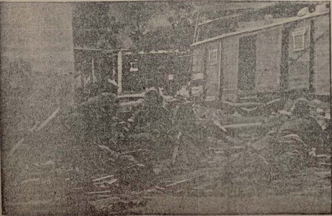
Un aspecto de la contienda en la ciudad septentrional de Peking