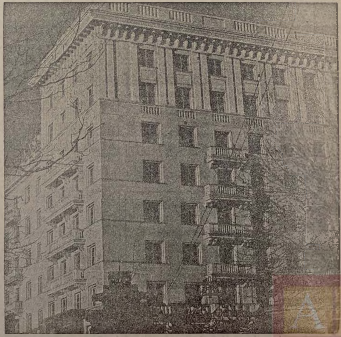
LA CASA DE LOS ESCRITORES Magnífico lugar de descanso en los alrededores de Moscú