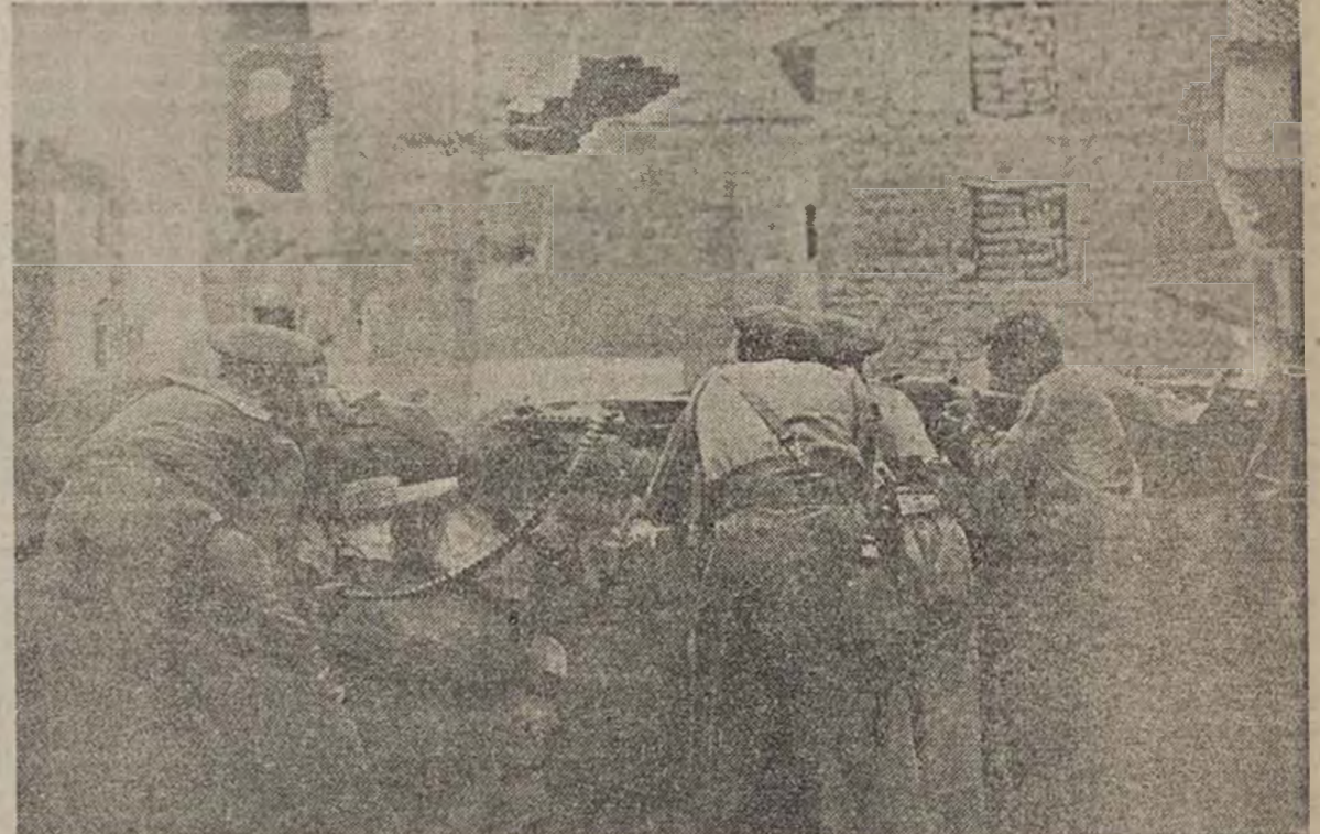
Un núcleo fascista intenta resistir aún en la iglesia de este pueblo, y los soldados del Ejército Popular, desde un parapeto recientemente ocupado, disparan sus armas automáticas para reducirlos definitivamente