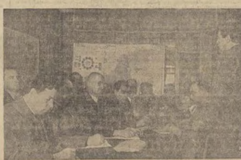
La sala de recreo del club ofrece al obrero soviético, en el descanso, ocasión de satisfacer su inagotable sed de cultura

Artículo 119. Los ciudadanos de la U. R. S. S. tienen el derecho al trabajo, al salario, a un trabajo igual salario idéntico, también han conseguido, al terminar su jornada de trabajo de siete horas, lo que Paul Lafargue, con ironía, había reivindicado para la clase obrera al pedir para ella "el derecho a la pereza".