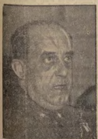
EL GENERAL POZAS

MADRID, 22.—El jefe de las operaciones del Centro, general Pozas, en una entrevista concedida a un periodista, ha hecho interesantes manifestaciones. Interrogado sobre la situación actual de nuestros combates, contestó: