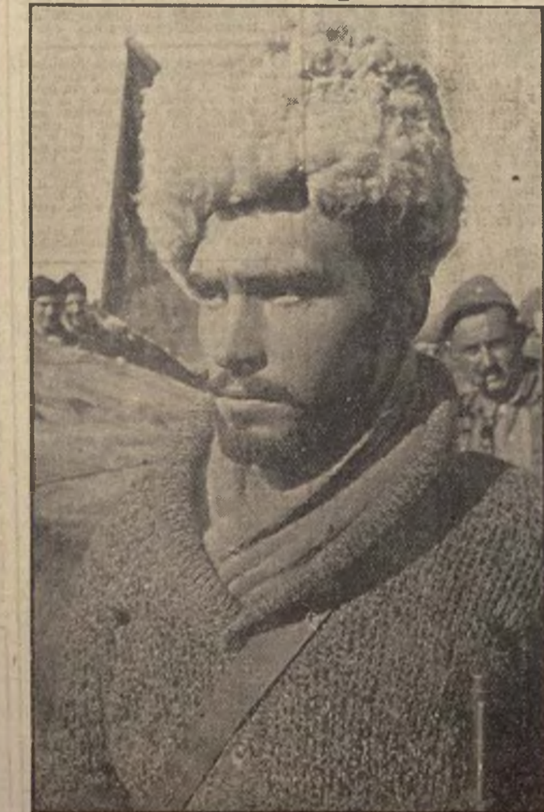
Con fortaleza de roble, con mirada firme y escrutadora, con el pecho henchido por los más altos ideales de libertad y justicia, este heroico soldado del Ejército popular, que en los frentes de combate ha cerrado el paso a la barbara invasión del fascismo nacional y extranjero, es la representación viva e impresionante del valor estovado, de la seguridad en sí mismo con que el proletariado español ha dado realidad y vigencia a la esforzada consigna de "No pasarán!" Estampa de guerra, personificación de nuestra lucha, imagen de nuestros anhelos reivindicatorios, lleva impreso en el rostro la decisión y el coraje que ha de llevarnos a la victoria final sobre los cobardes rebeldes, traidores a su patria y al pueblo que habían prometido servir.