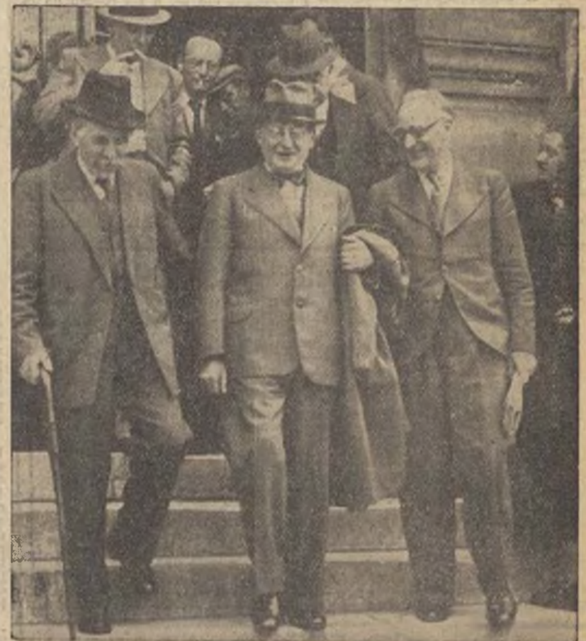
Marcel Cachin, saliendo de la última reunión celebrada por el Partido

tracido por la que se envía una nota al Partido Radical-Socialista haciendo constar que "los reunidos manifiestan sus sentimientos cordia-