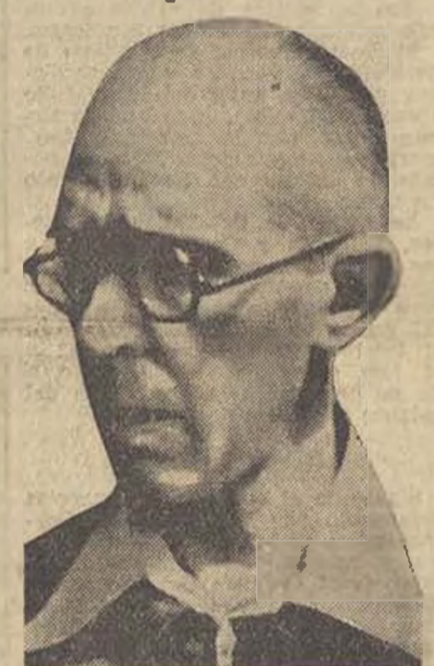
El heroico general Mangada, legatario a la gloria del Ejército Republicano, a quien acaba de rendirse en Madrid un sentido homenaje.

Las baterías de Montjuich que, como ya hemos dicho, repelieron con gran prontitud la criminal agresión, lograron acallar al poco rato el fuego enemigo, poniendo en precipitada fuga al buque rebelde.