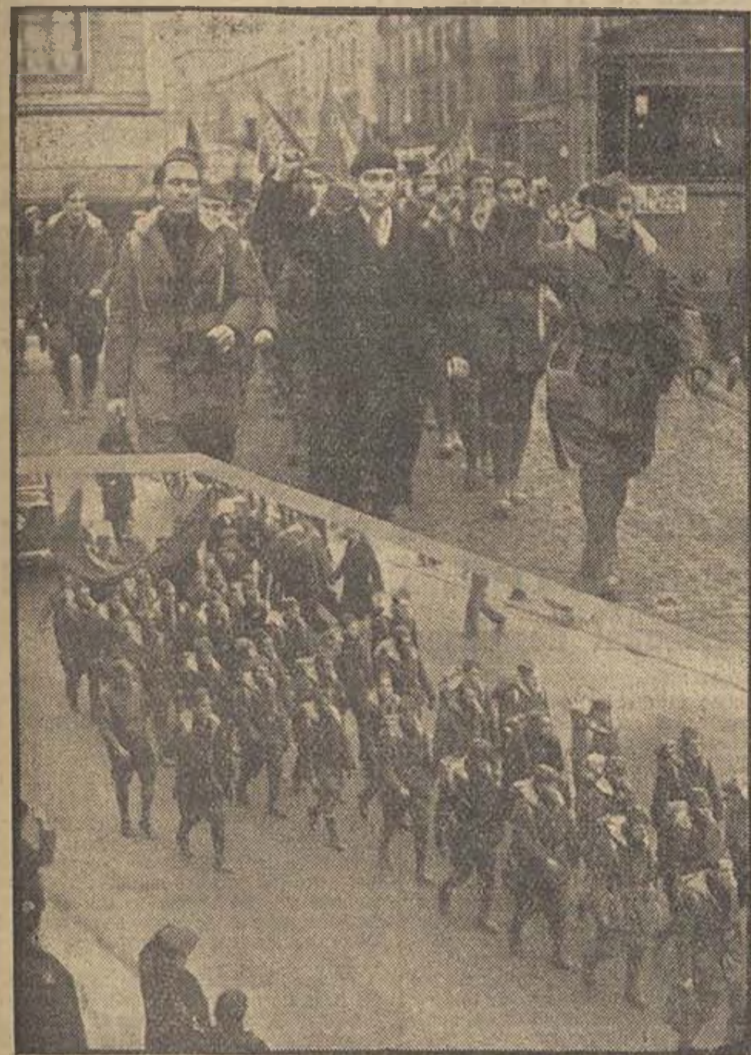
Siguen llegando a nuestros frentes grandes contingentes de voluntarios extranjeros, que vienen animados del más firme deseo de vencer, porque nuestro triunfo — lo repetimos una vez más — será el triunfo del proletariado mundial.

Proletarios de todos los países vienen unidos en filas interminables a engrosar nuestro Ejército popular. Ejemplo: los voluntarios americanos que el domingo llegaron a Barcelona, de cuyo desfile por nuestras calles reproducimos aquí dos aspectos.