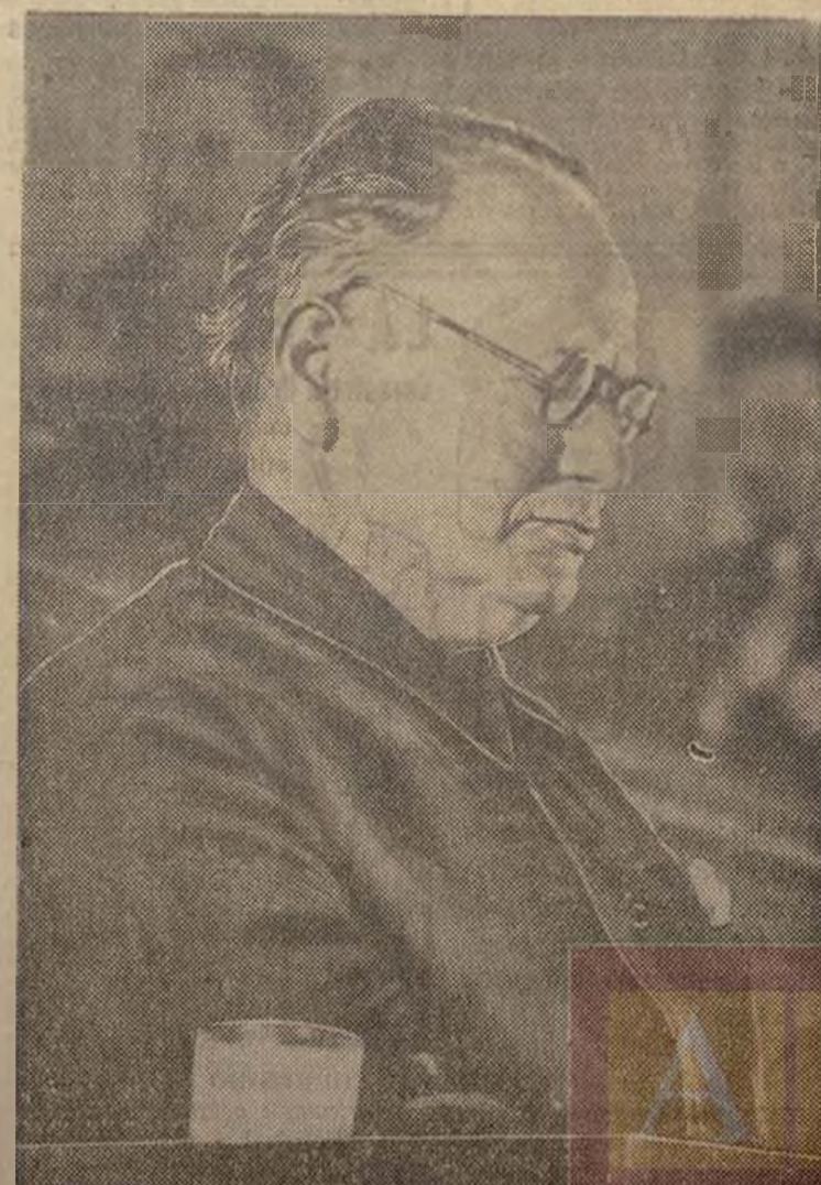
El pueblo de la Unión Soviética ha dicho, por boca del camarada Litvinov, que los países fascistas no envían voluntarios a España, sino soldados con fines militares.