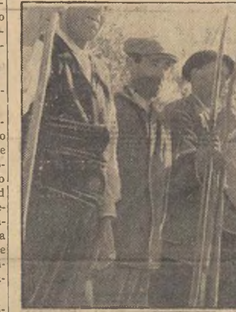
Los campesinos, sin temor a los obuses, recogen la aceituna.

En la Legión han ingresado también todos los aventureros que buscaron en África un refugio contra los ojos de la Policía europea. Mas los caballeros legionarios del frente de Arganda presentan, además, otras características no menos interesantes. Por ejemplo, todos cobran cuatro pesetas con diez céntimos por día. Me-