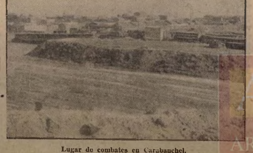
Lugar de combates en Carabanchel.

Valencia, 24.—Se encuentra en Valencia una de las figuras más destacadas de la intelectualidad mejicana. Se trata de Adolfo Sequeiros, organizador del Sindicato Minero de Méjico y de la Confederación Unitaria de aquel país. Los periódicos le dan la bienvenida.—Febus.