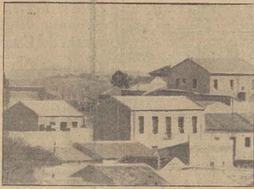
Casas conquistadas en Carabanchel.

El periódico "L'Oeuvre" dice que si no se ejerce también el control sobre las unidades del Tercio y fuerzas marroquíes, no habrá posibilidad de impedir la llegada de tropas extranjeras a España, pues los italianos seguirán el procedimiento de alistarse a sus voluntarios en las banderas de la Legión.—Fabra.