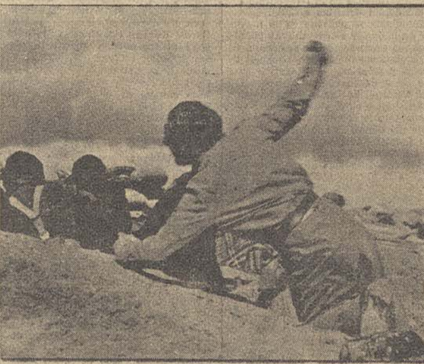
LAS VICISITUDES DE LA LUCHA AUMENTAN EL TESON Y EL HEROISMO DE TODOS LOS SOLDADOS, DE TODOS LOS ESPAÑOLES.

Ministerio de Defensa Nacional. — Parte oficial de guerra: