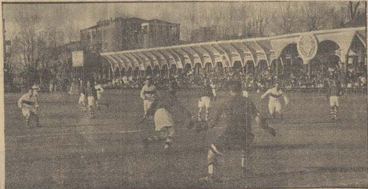
U. R. S. S. — MATCH DE FOOT-BALL EN EL CAMPO DE SMOLENSK

Las manifestaciones de afecto a los pequeños excedieron a toda ponderación frente al Consulado de Orán, la C. G. T. y la «Casa España», donde se vitoreó entusiastamente a la República española.