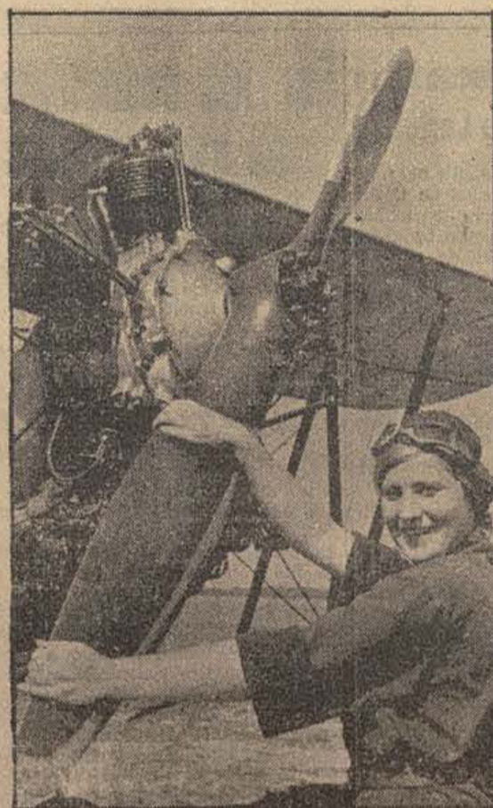
U. R. S. S. — Un muchacha que acaba de obtener su título de piloto en una de las Escuelas de Aviación.