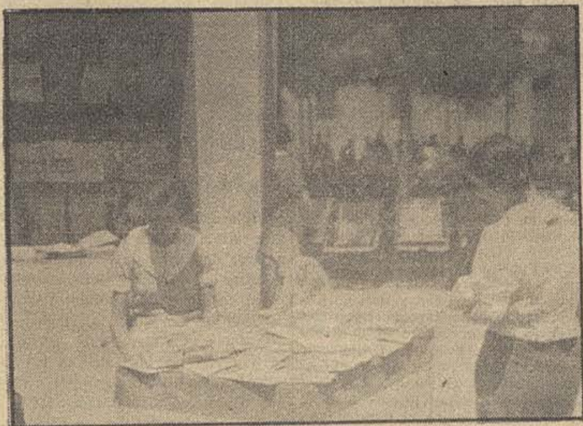
UN «STAND» DE LIBROS EN UNA DE LAS CALLES DE BARCELONA.

Cada jefe y comisario con su responsabilidad inmensa, cada soldado con su obligación y disciplina, deben ser fieles a esta orden de la Patria.