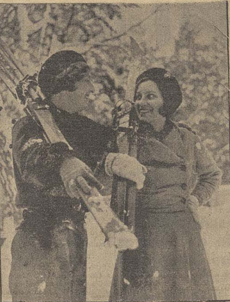
ESTUDIANTES SOVIETICAS DE LA ACADEMIA AGRICOLA «TIMIRIAZEV» EN DIA DE VACACIONES.

Londres, 15.—El corresponsal en Valencia del «News Chronicle» Forrest, dice que también ayer fueron atacados en el puerto de Valencia por la aviación fasciosa barcos ingleses que llevaban a bordo observadores del control. El corresponsal añade que las bombas cayeron a menos de 100 metros del