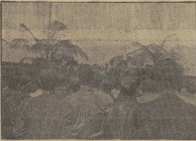
UN ACTO CELEBRADO EN BARCELONA EL «DÍA DEL LIBRO» (Foto Mayo).

Pongamos un digno colofón al Día del Libro en Cataluña llenando con generosidad la petición del Comisariado de los Servicios Sanitarios del Ejército del Este.