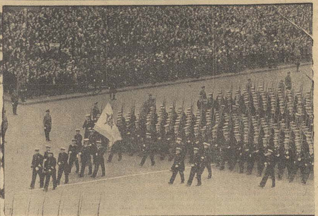
MOSCU. — UN DESFILE DE LA MARINA ROJA

lar la importancia sintomática de que ayer se le desmandasen a Chamberlain, por primera vez desde que es primer ministro, un par de significados diputados conservadores que no pertenecen al grupo Eden y que hasta ayer habían cubierto en la Cámara de un modo incondicional cada gesto del primer ministro. — Agencia España.