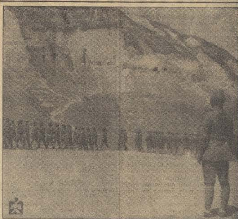
CHINA.—En la Escuela de Lenan.— Los estudiantes, si bien terminan sus estudios, se equipan e instruyen militarmente y parten para el frente.